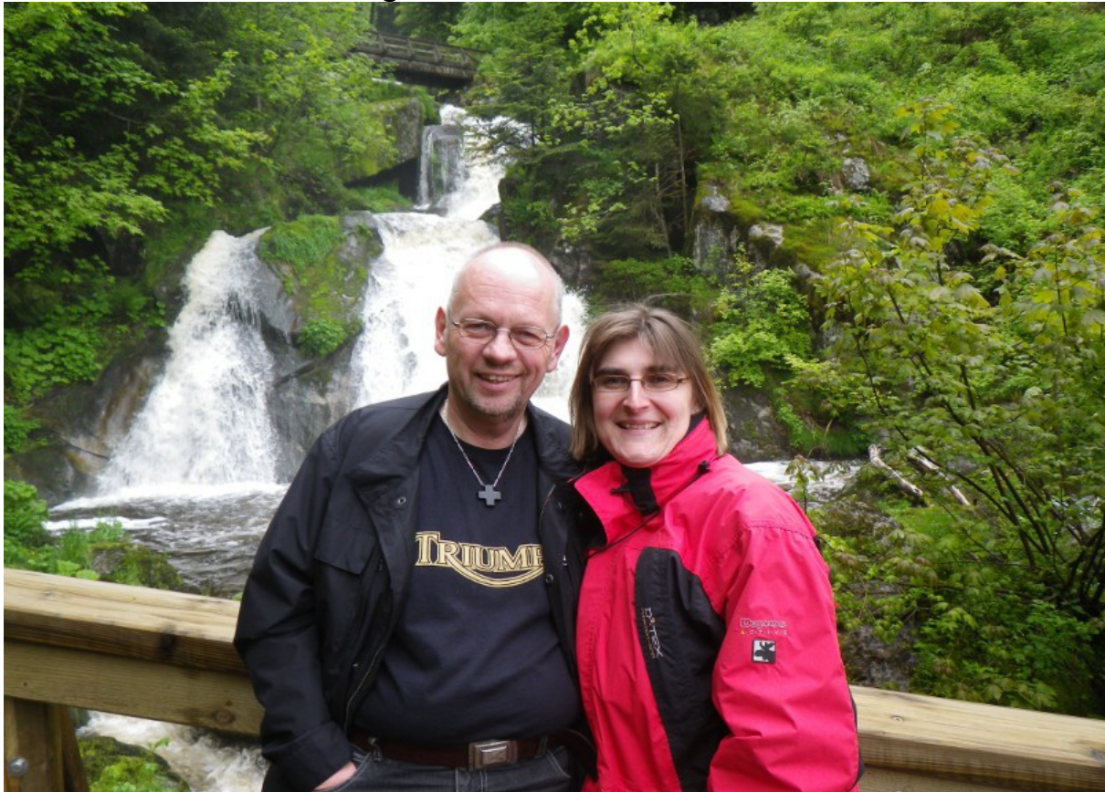
Danach hatte Petrus ein Einsehen und ließ tatsächlich ein paar Sonnenstrahlen frei...