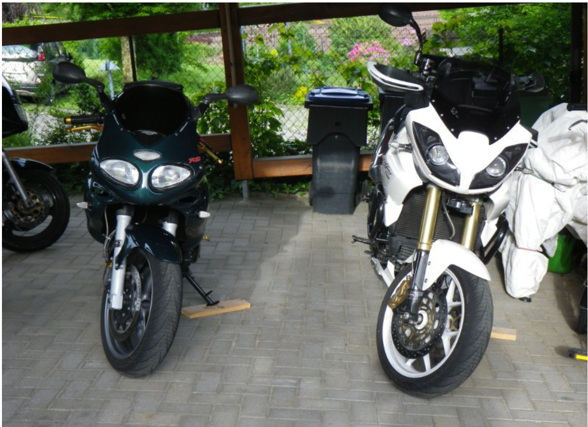
und abends standen auch unsere beiden Lady's im Sonnenschein