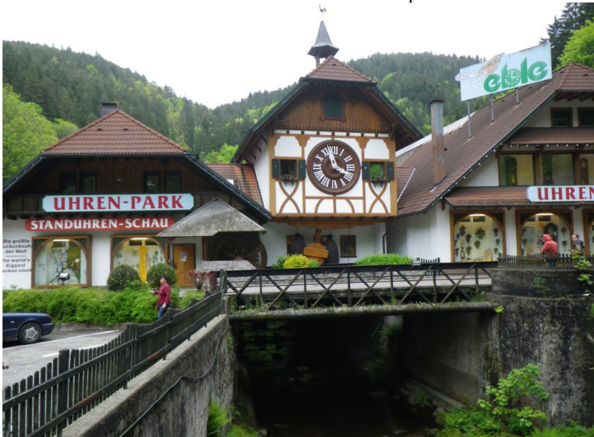
Überall Uhren und da sollst´e keinen Tick bekommen hi, hi, hi...