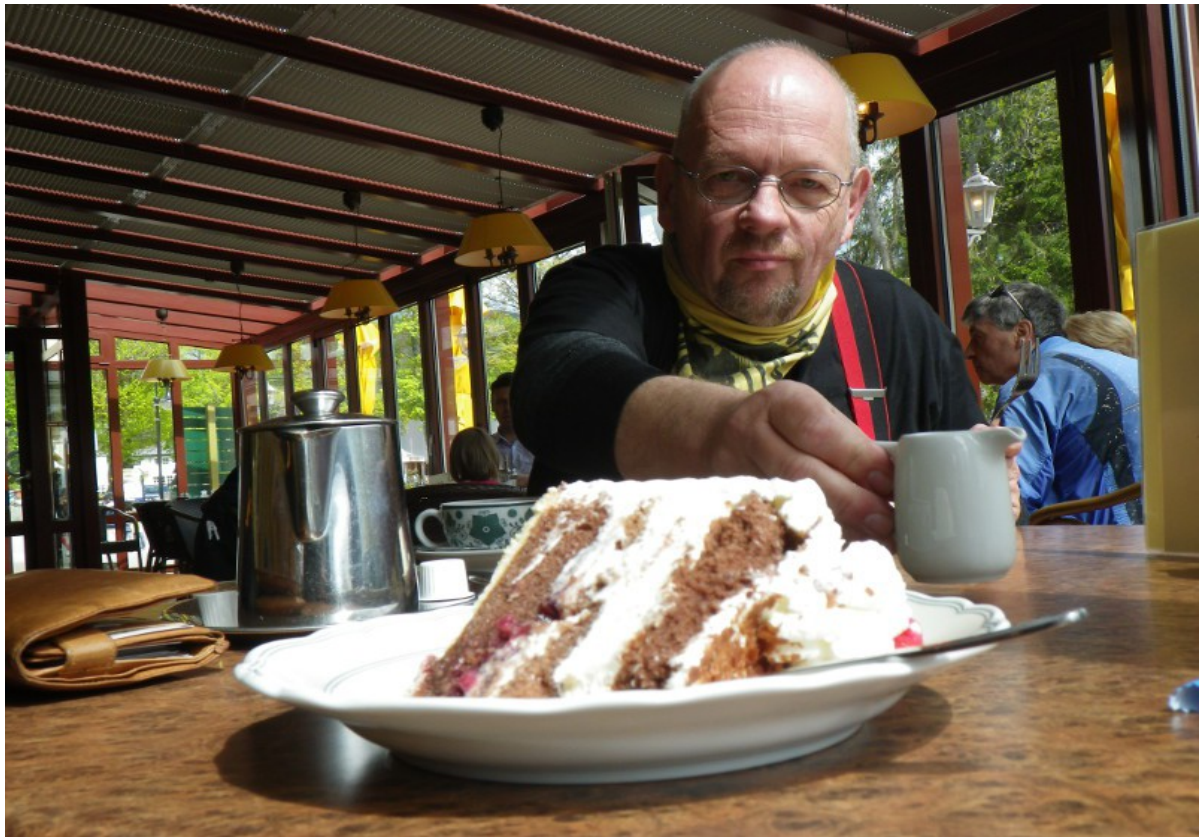
Noch eine Schwarzwälder Spezialität, direkt am See und nicht mal teuer...