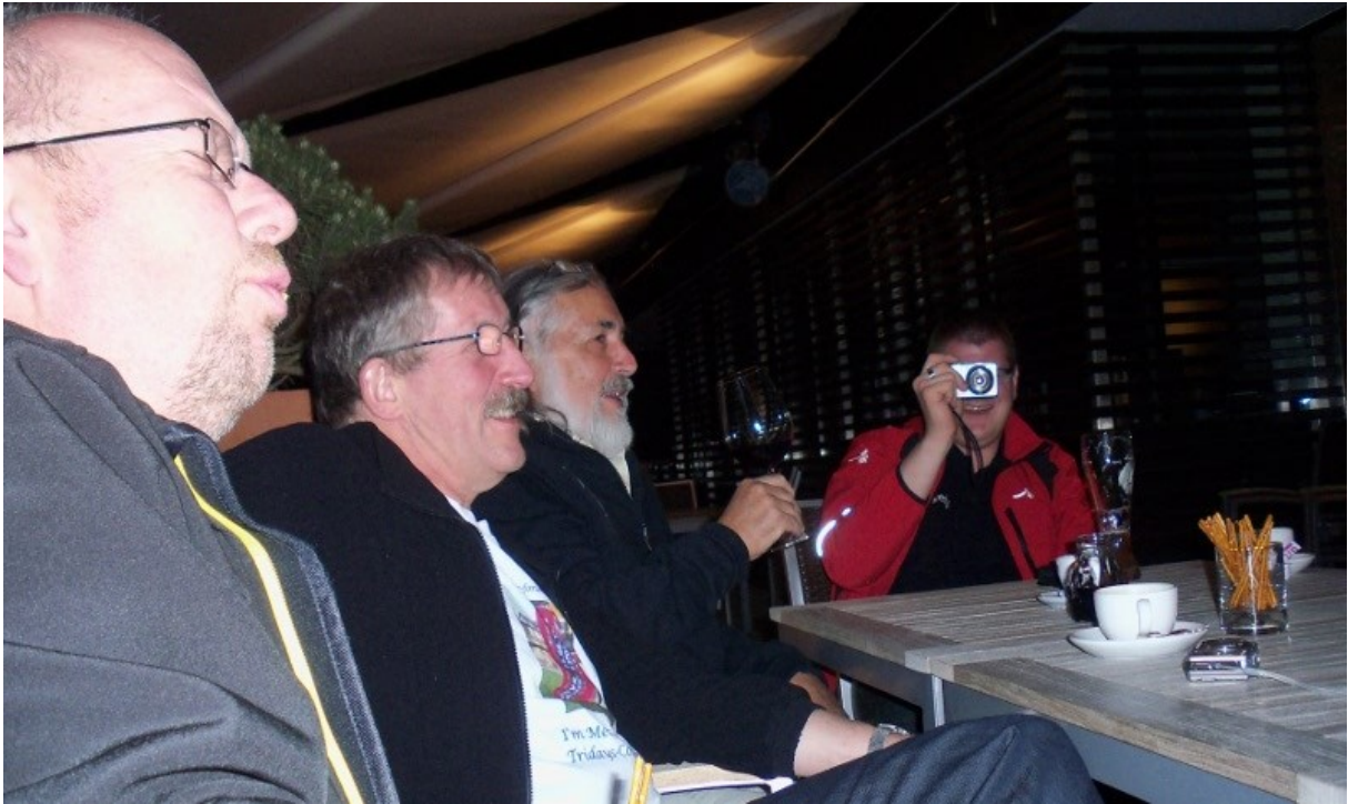
Der erste Abend und schon hatte einer 'ne Digi....