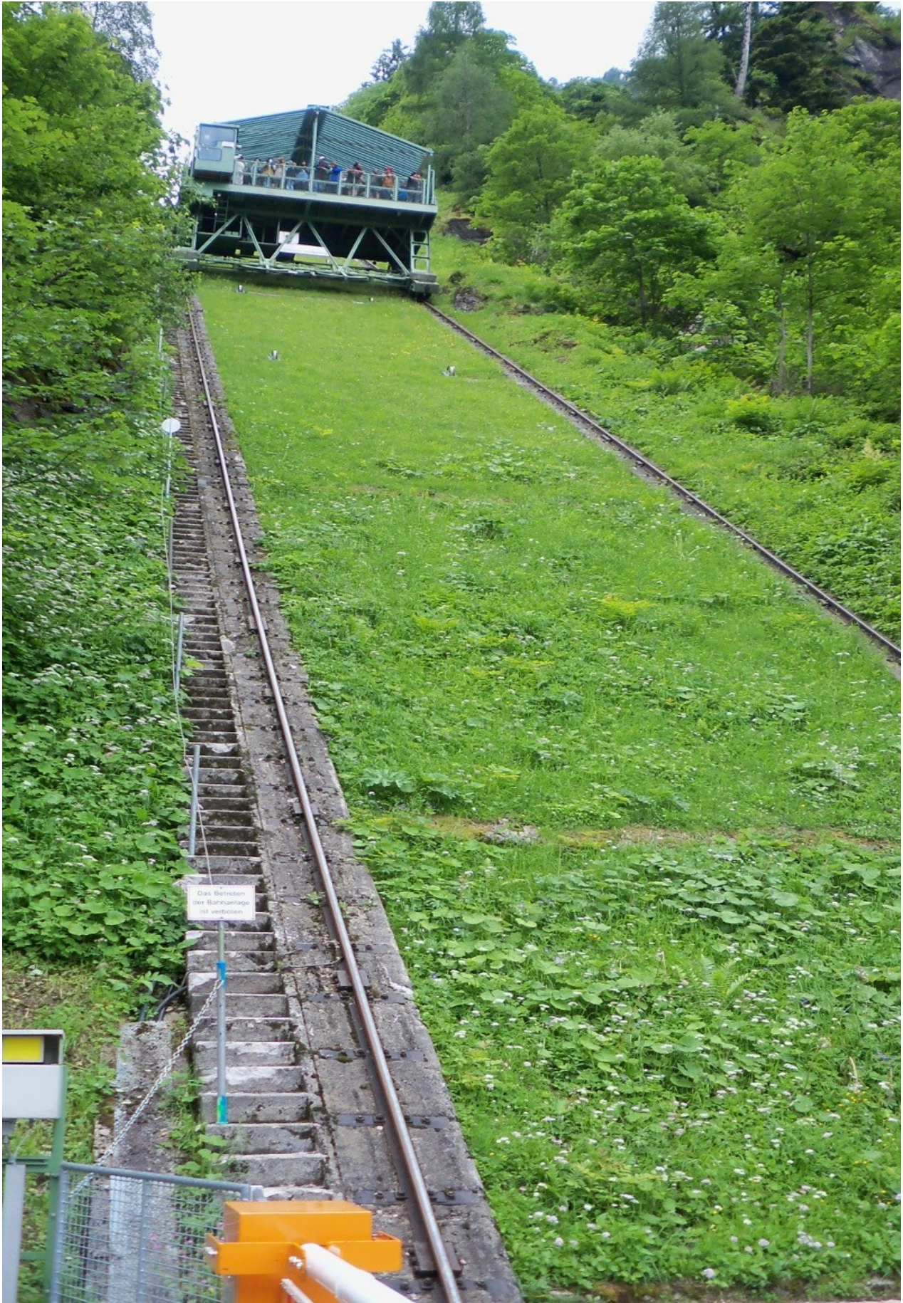
da ging's ganz schön steil rauf....