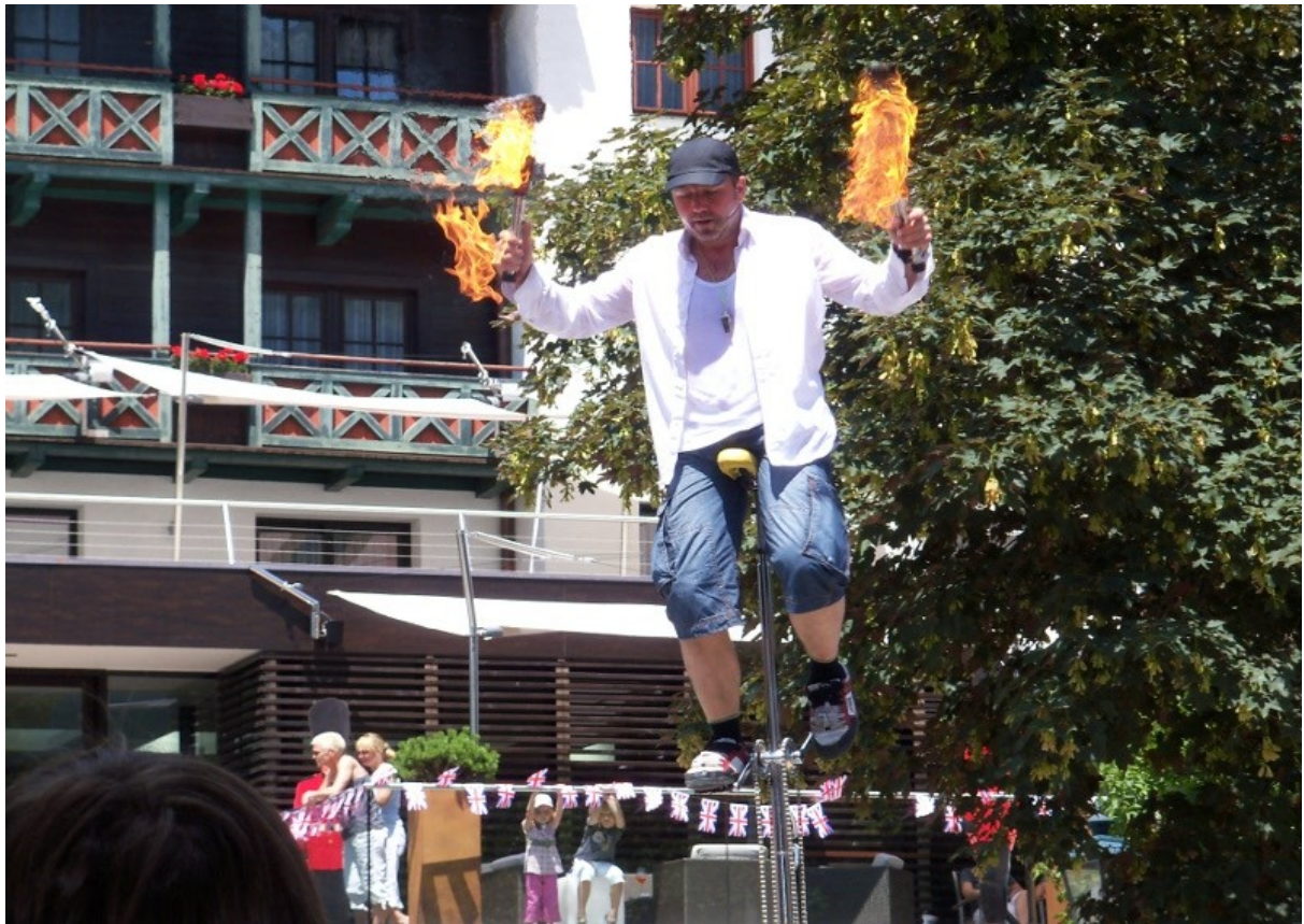
der absolute Knaller des Tages...