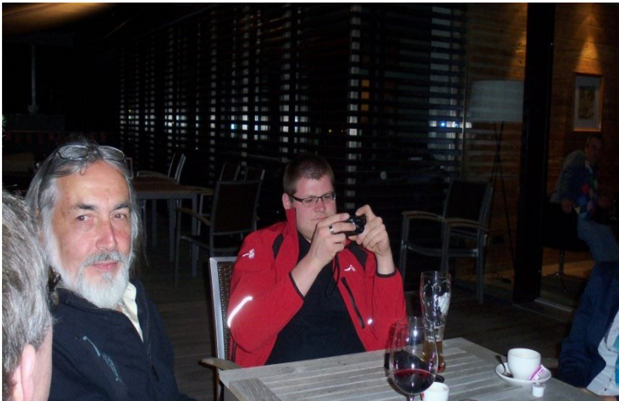
Ja wo ist denn jetzt das Vögelein...