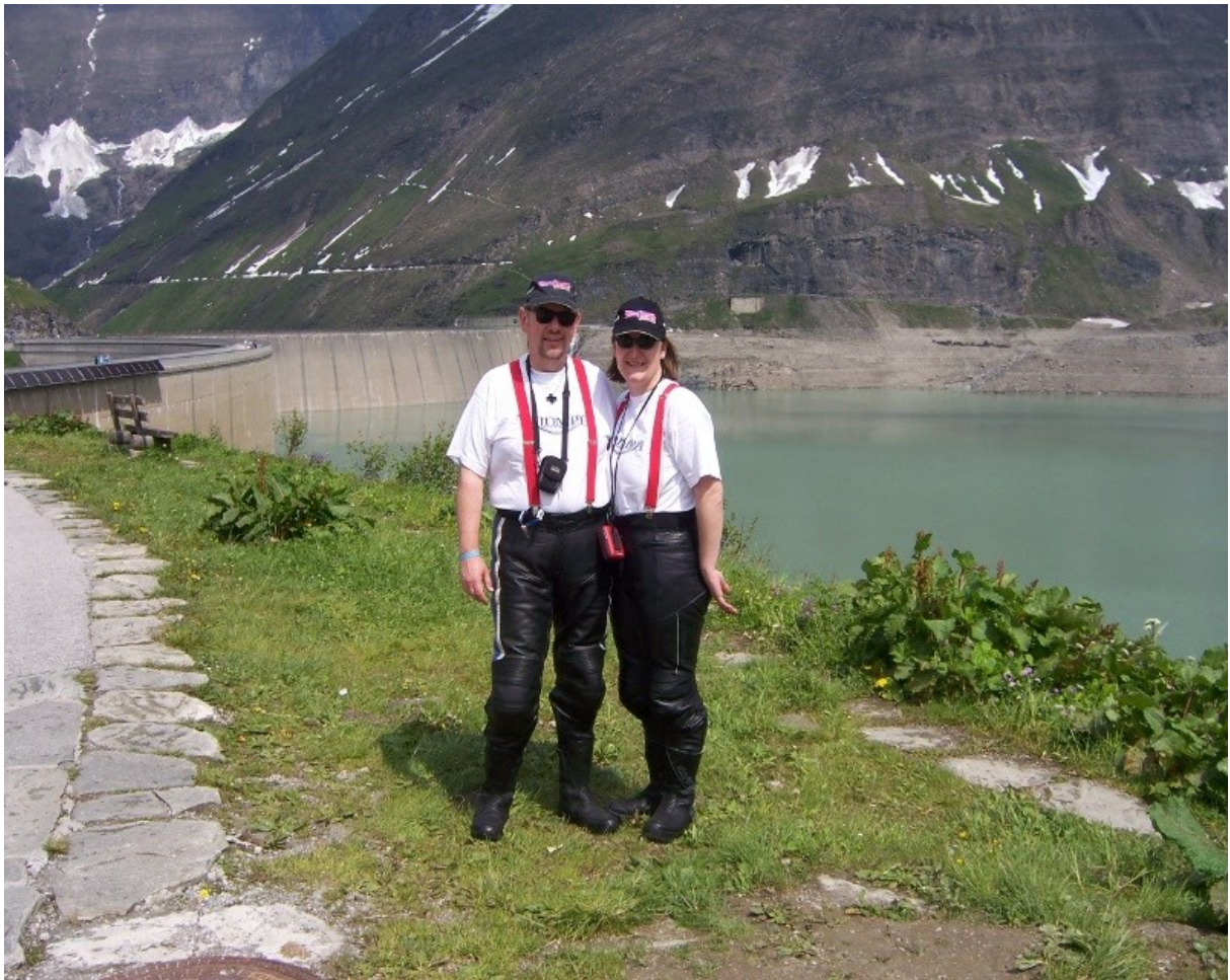
Wir haben am Samstag einen Ausflug an den Stausee Kaprun gemacht,