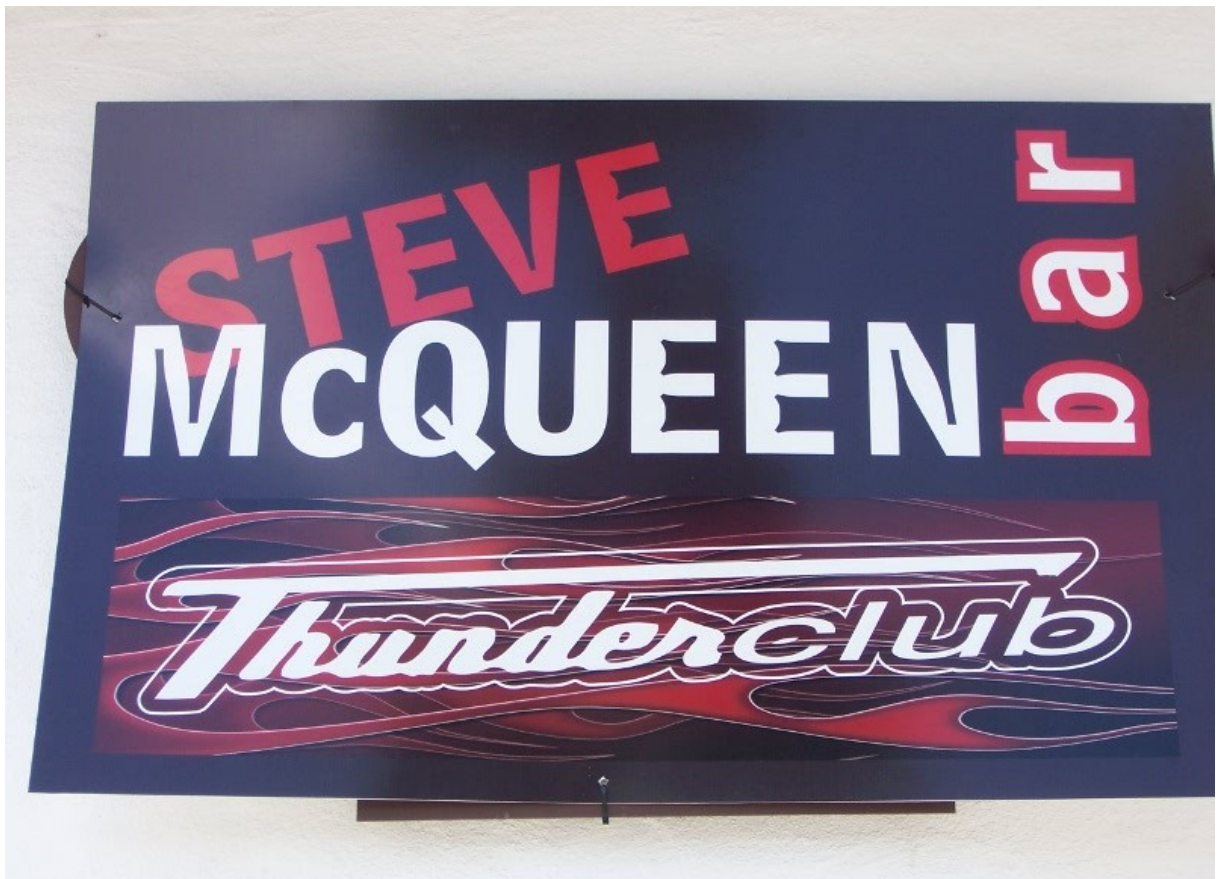
Gut, dass der Knilch beim Kettensprengen 'ne Triumph dabei hatte...