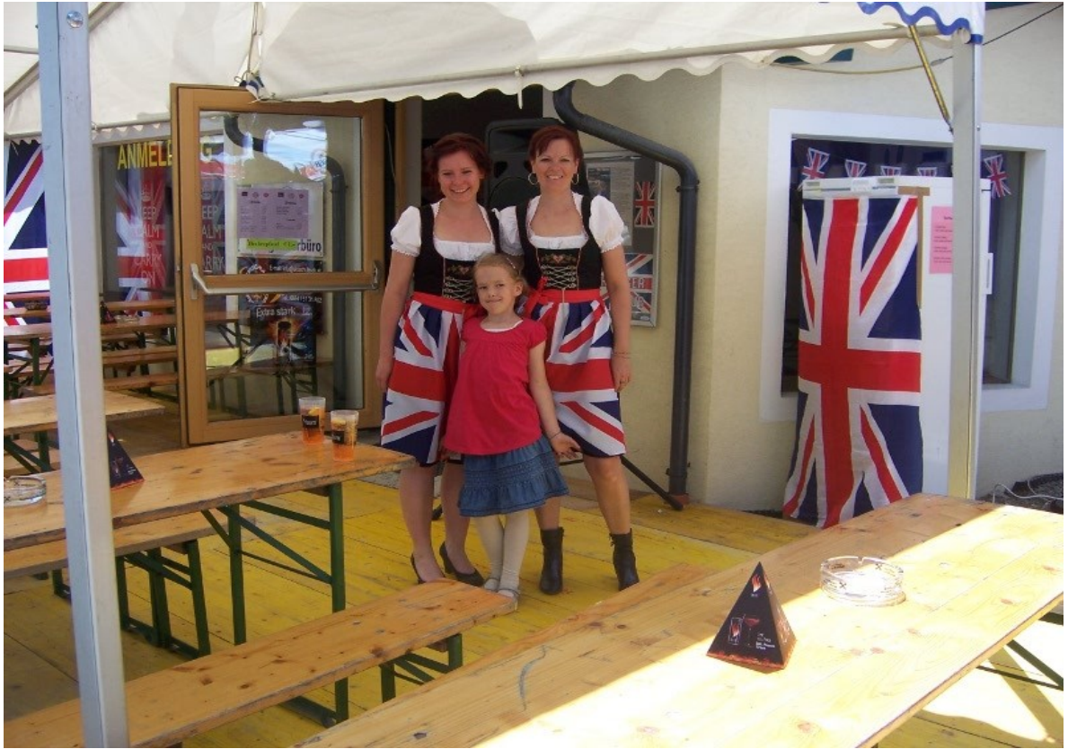
Schee san's, die Madeln, gell?