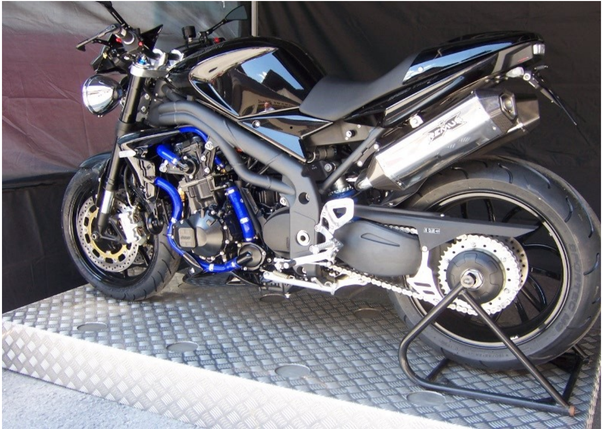
noch so'n paar Edelteile...