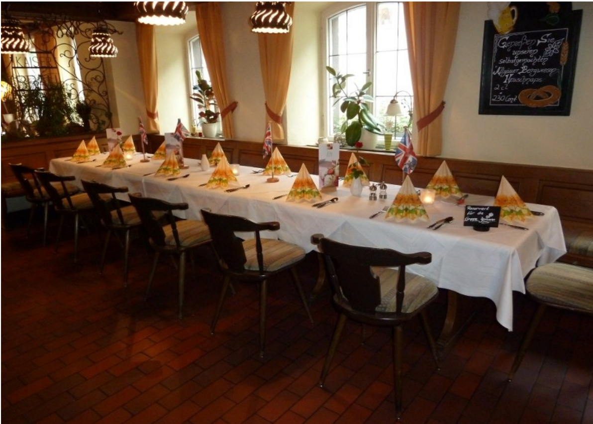
die Tafel ist fertig, die Gladiatoren können kommen....