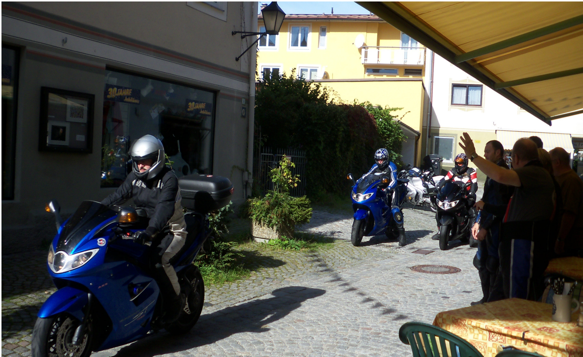
die Schweizer Fraktion verlässt Immenstadt....