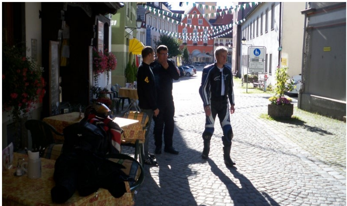
also gut, wenn´s denn sein muss....