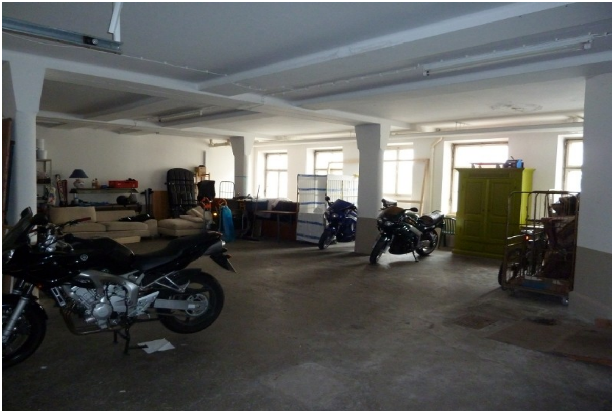
die noch fast leere Garage....