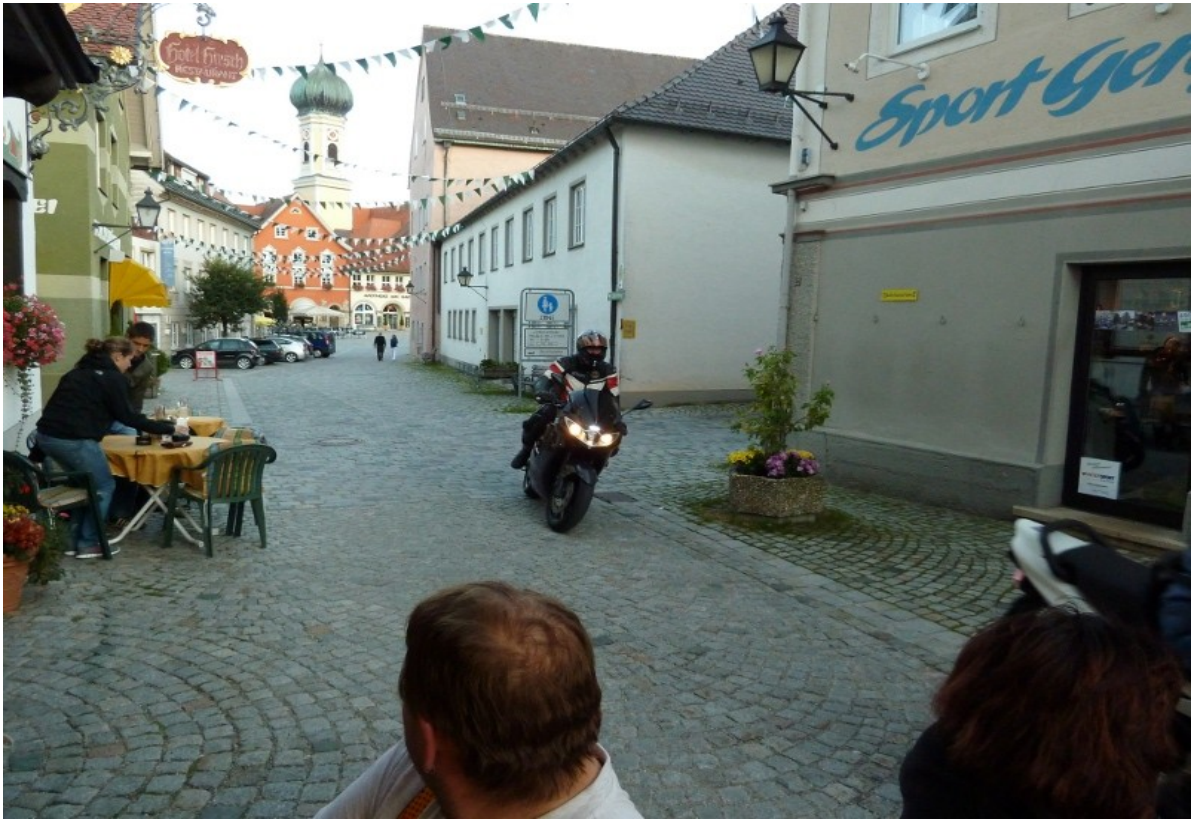
ja, wer is jetzt des....?, sieht aus wie Speedy.....