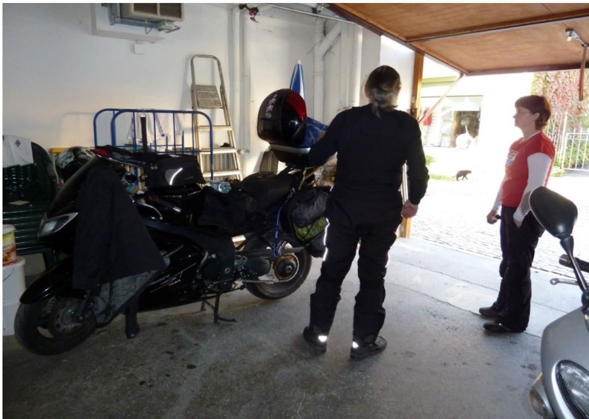
Fachsimelei in der Garage, wo die Maschinen stehn...