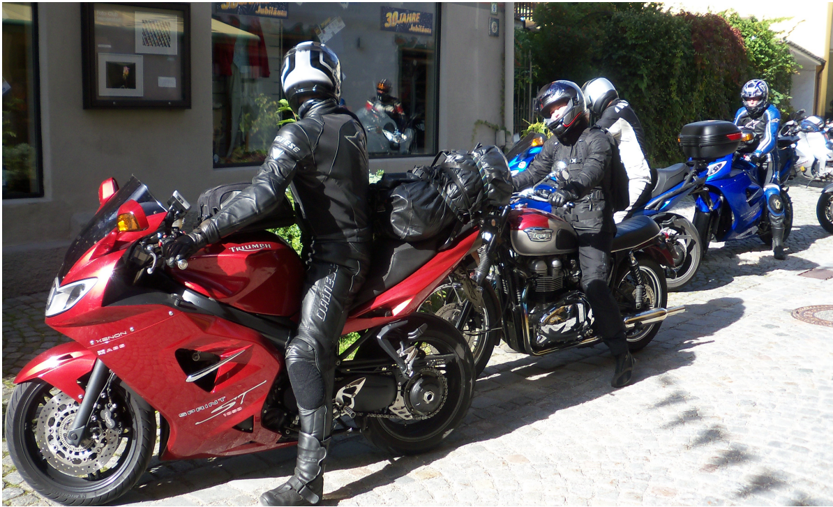
hast Du auch alles eingepackt? Das letzte Mal hat was gefehlt....