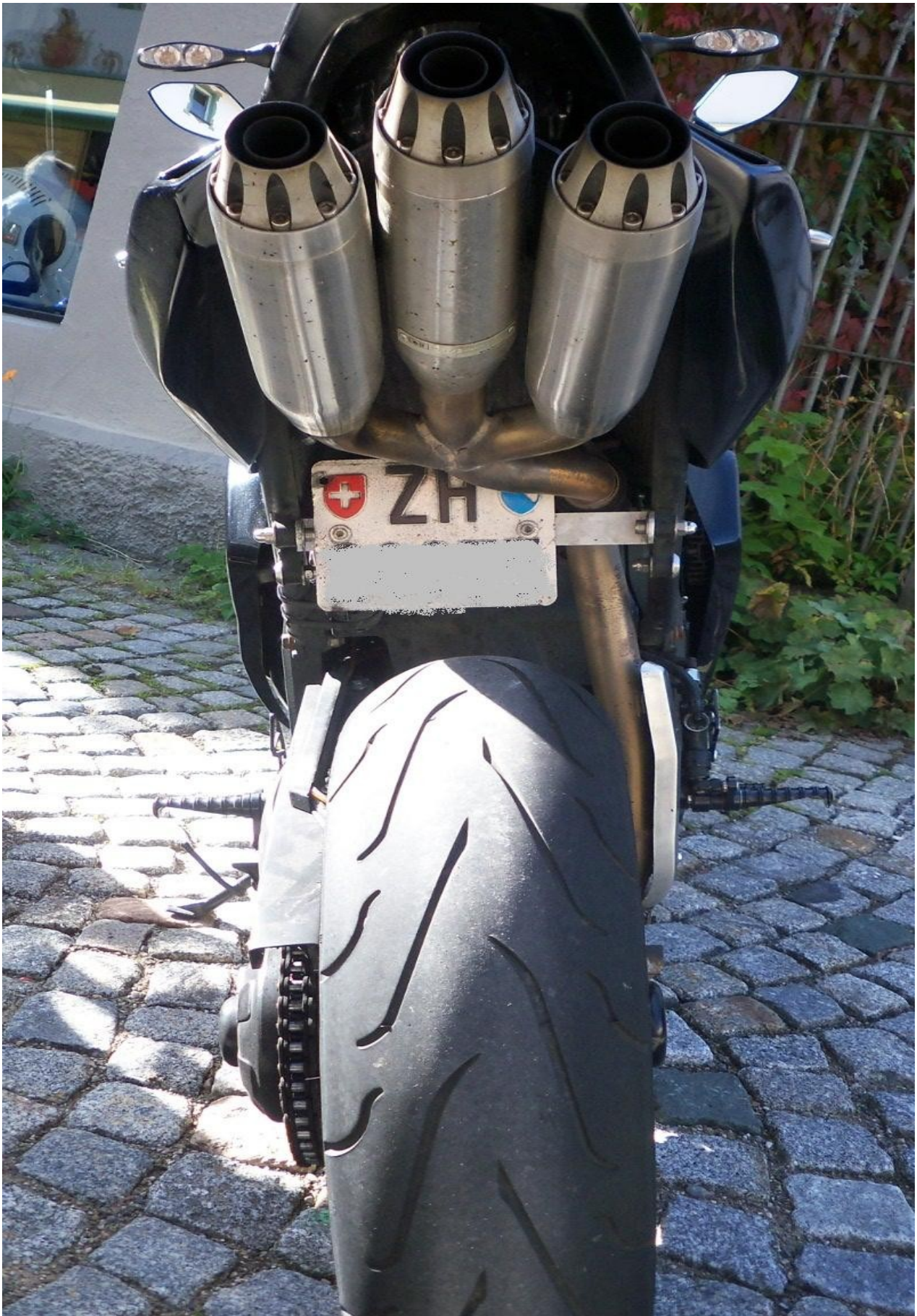
is ja irre und das alles mit Eidgenössischer Erlaubnis....