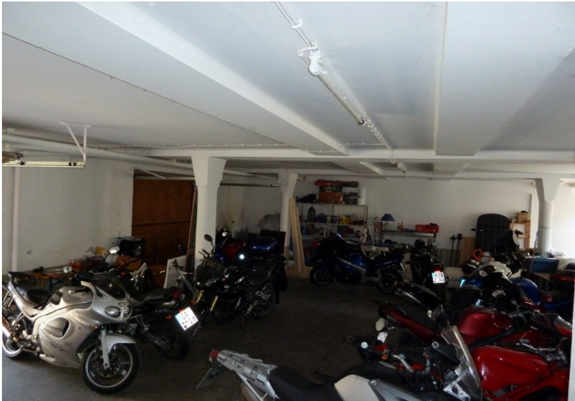
die schon etwas gefülltere Garage....