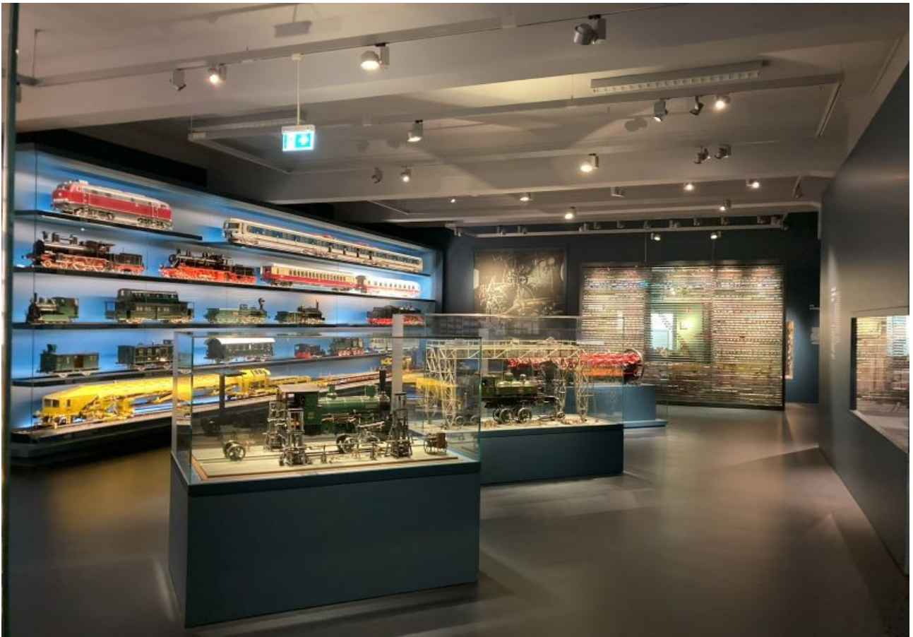
Große und kleine Lokomotiven sind hier ausgestellt, für jeden was