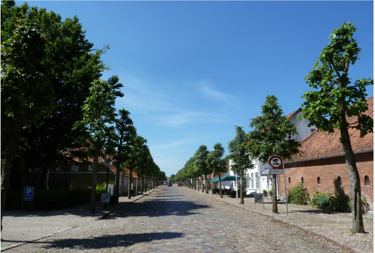
Mogeltonder in Dänemark, ein wunderschönes kleines Dorf mit einem Schloss des Kronprinzen, leider in Privatbesitz, daher nicht für die Öffentlichkeit zugänglich.