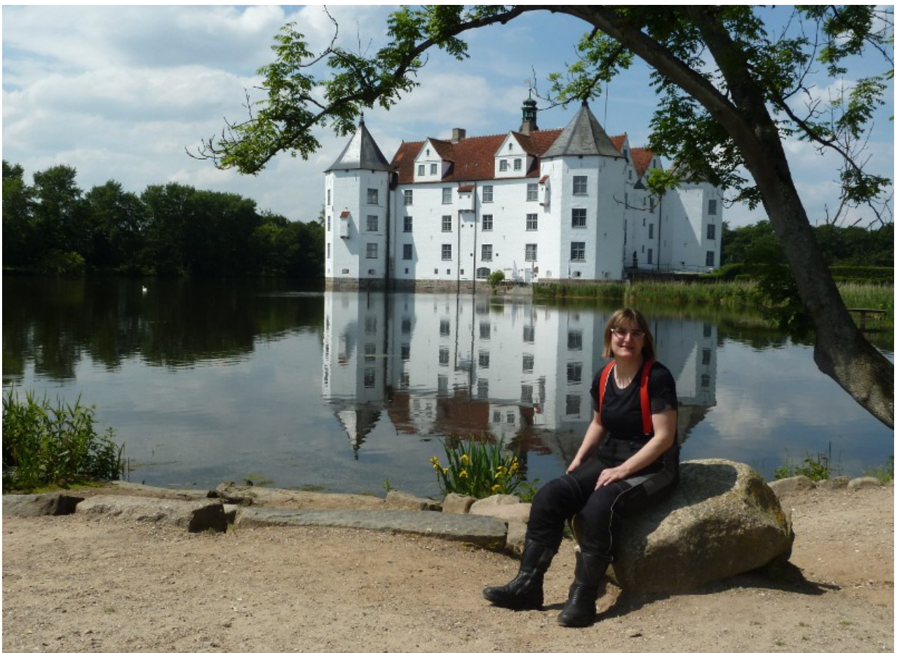
Mein Goldstück vor dem Wasser Schloss von Glücksburg