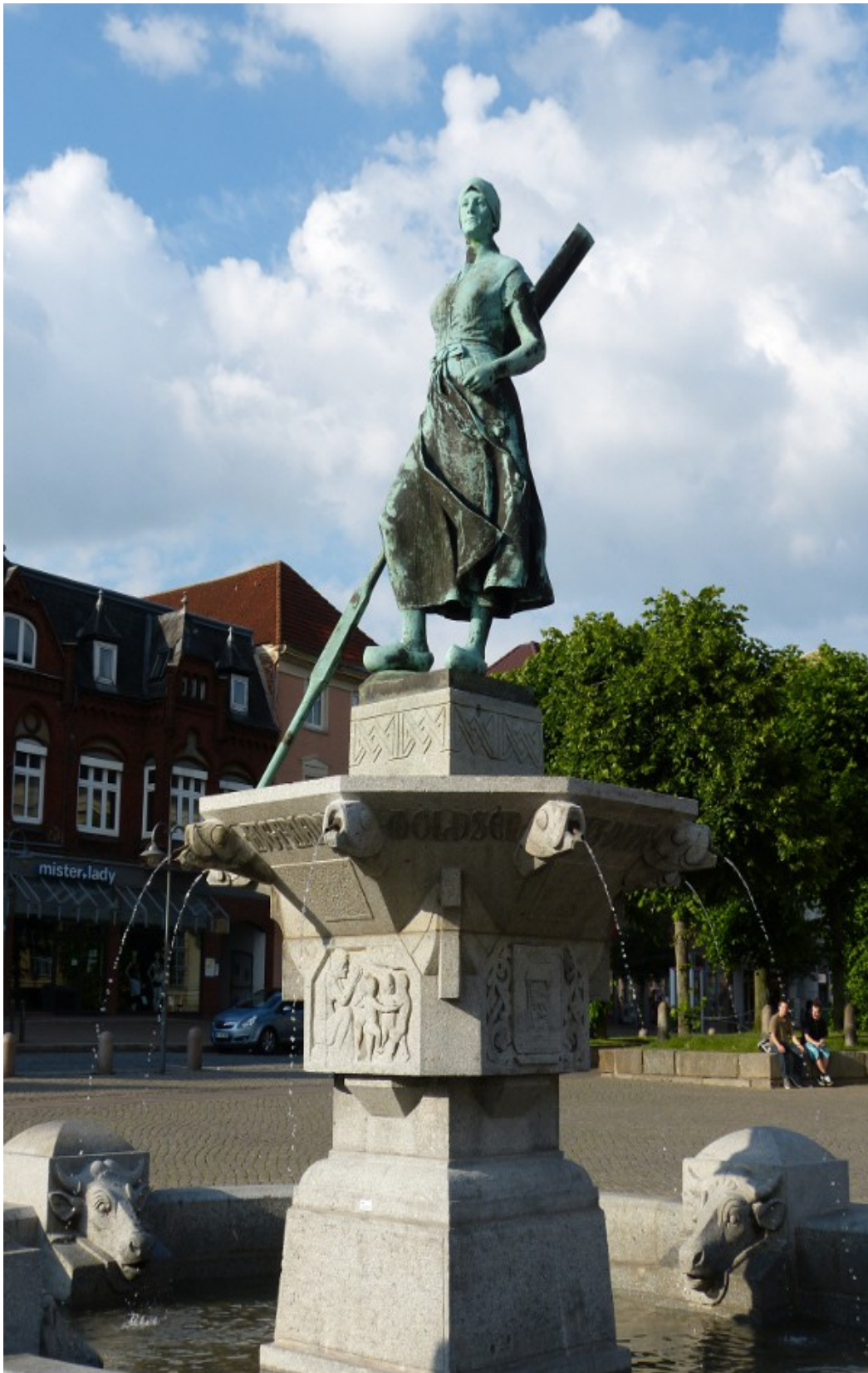
Das heimliche Wahrzeichen von Husum, die Tine und ihr Brunnen, stellt eine Fischersfrau in der damals üblichen Tracht dar. (Anfang 19tes Jahrhundert)