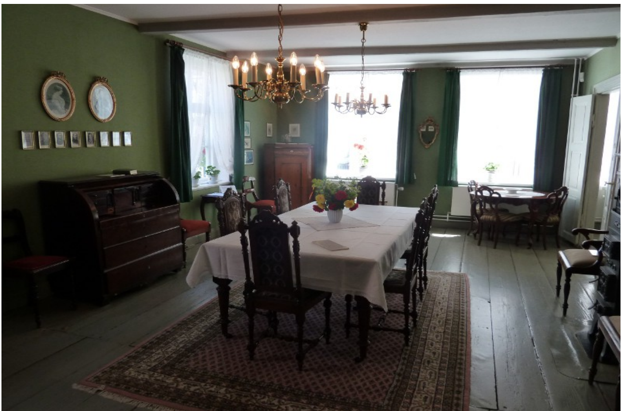
Das Wohnzimmer von Theodor Storm