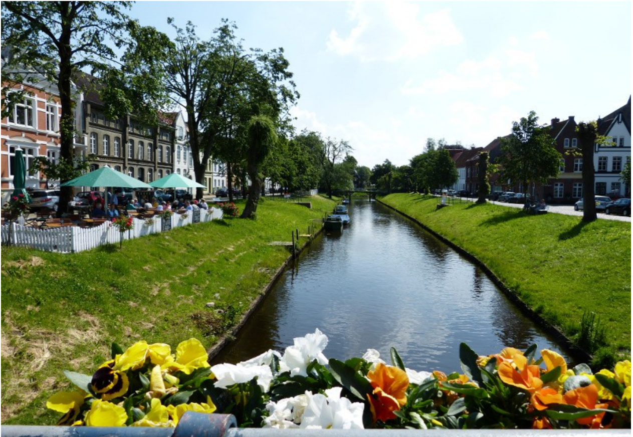
Friedrichstadt, immer eine Reise wert