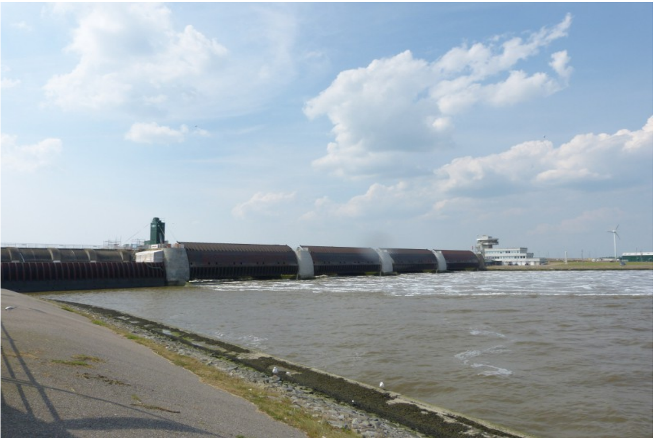
Das Eidersperrwerk, eine gigantische Anlage und als wir da waren lief das Wasser in Richtung Binnenland statt ins Meer, ganz schön schräg für einen Nichtfriesen...