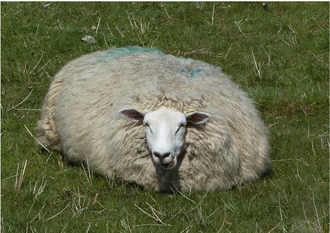
Und hier einer von den Deichen an der Nordsee, man nennt diese Art auch scherzhaft Deichrasenmääääher hi, hi, hi...