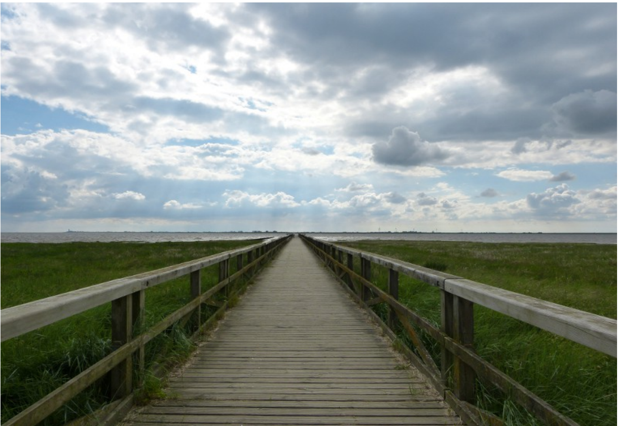
Der Blick von Schobüll nach Nordstrand