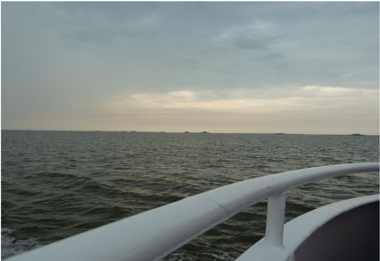
Der Blick vom Boot auf die Halligen...