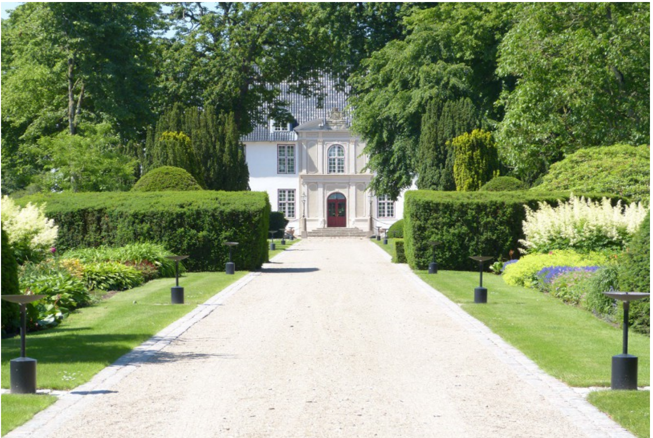
Das Schloss ohne Gitter...