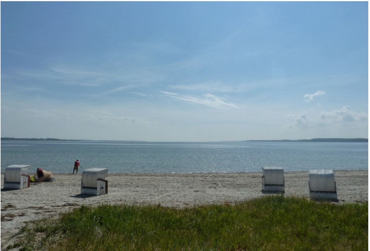
Die Ostsee bei Glücksburg, traumhaft...