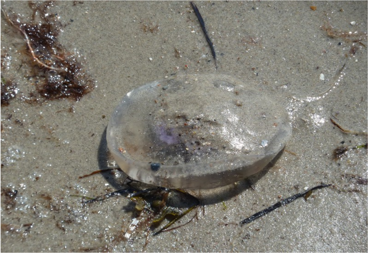
Ein typischer Ostsee Bewohner...