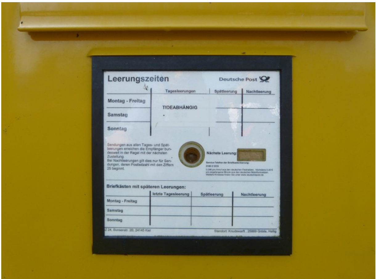
und die flexiblen Leerungszeiten der Post auf Hallig Gröde!