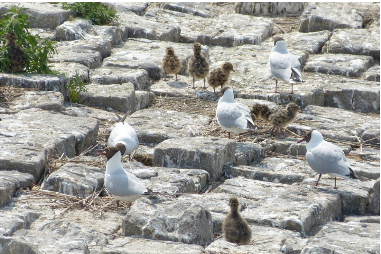
...aber offensichtlich ein wahres Vogelparadies, mehrere Hunderte von Möwen und Schwalben die hier brüten.