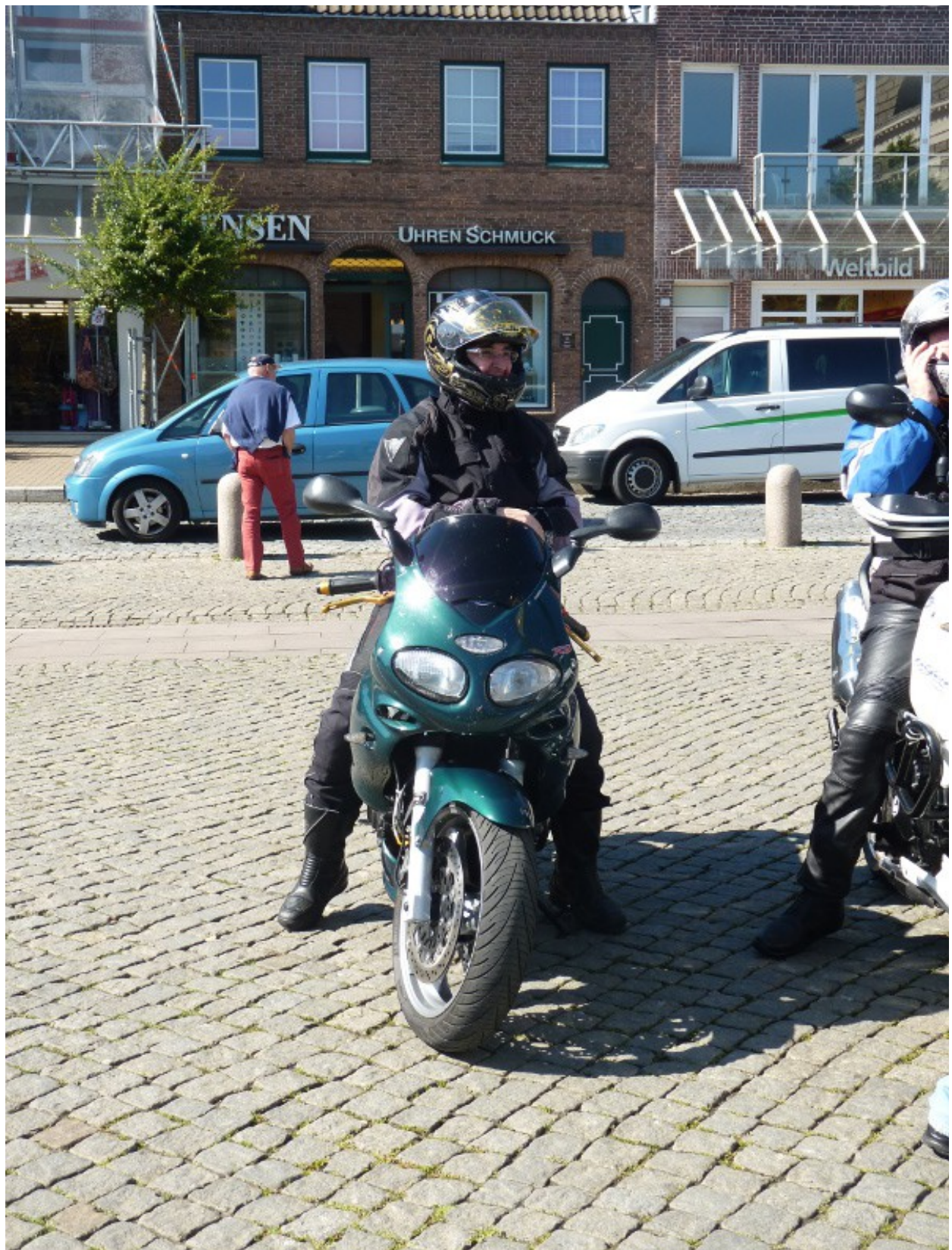
Mein Goldstück mit dem Motorrad auf dem Husumer Marktplatz...