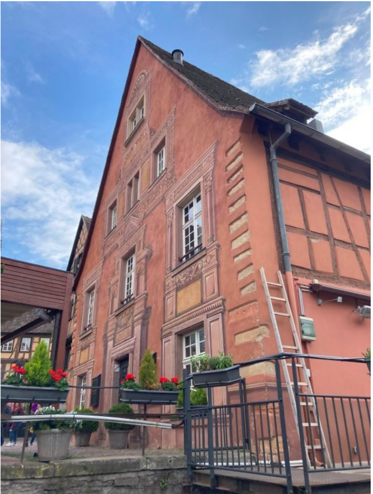
Fensterln funktioniert bei uns in Bayern irgendwie anders...