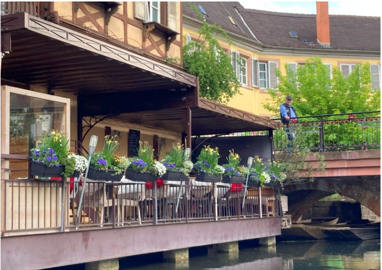
Ups, erwischt hi hi hi