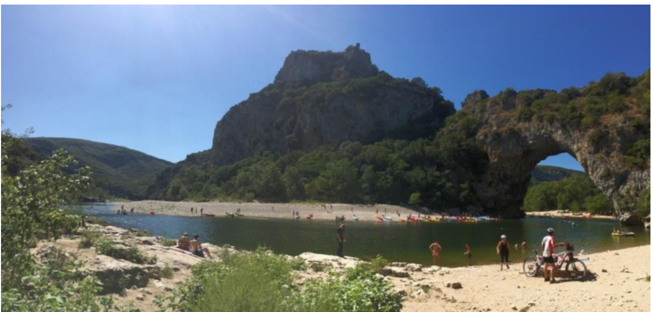
Der wohl bekannteste natürliche Steinbogen an der Ardeche