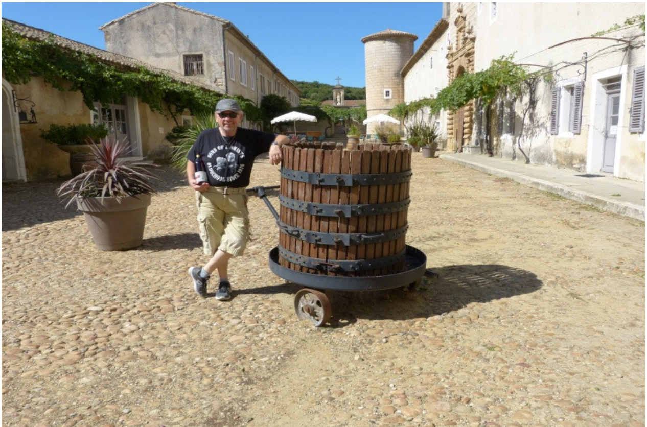
Eines der vielen Klöster mit einem meiner Lieblingstropfen..