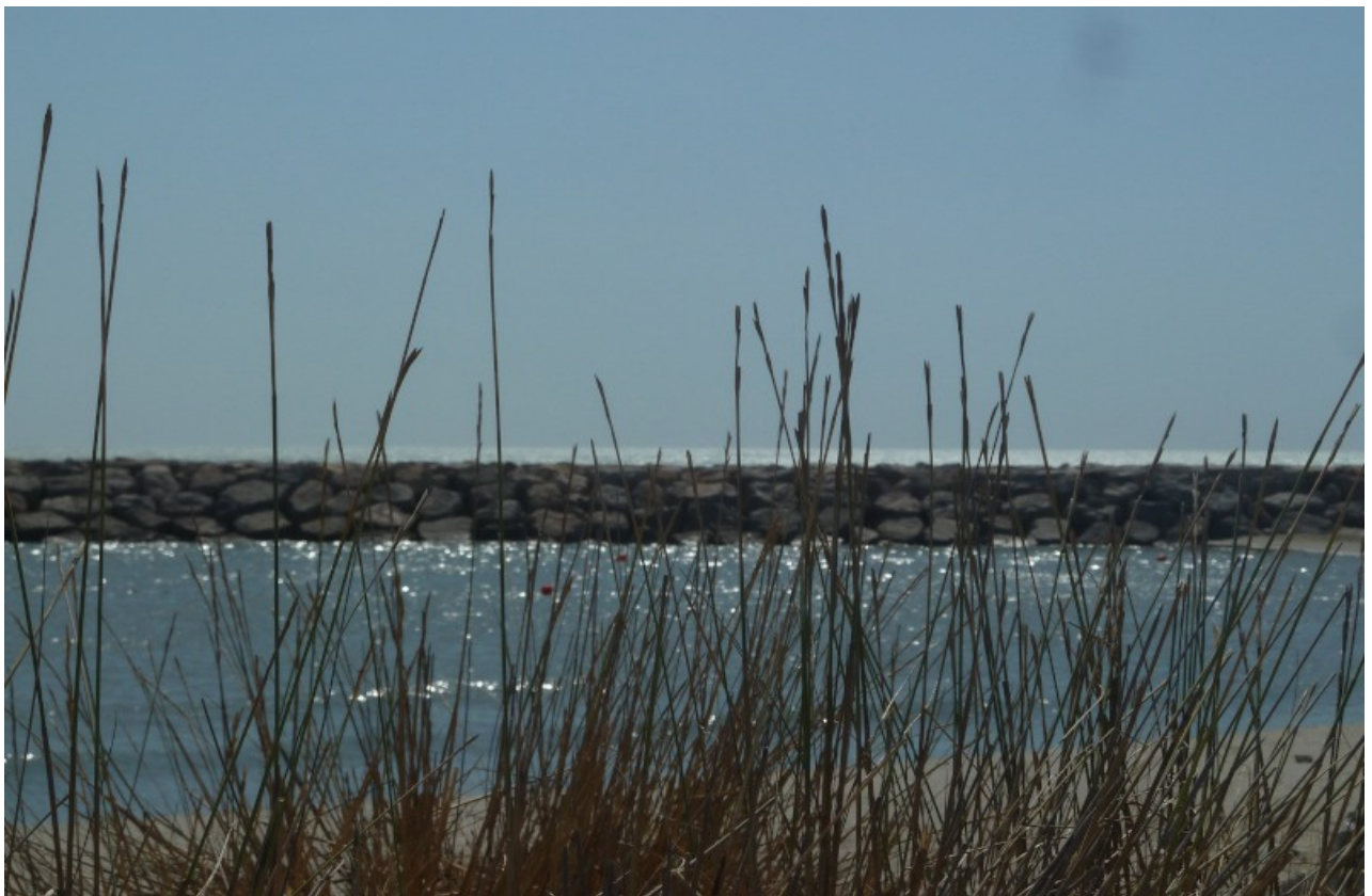
Impressionen vom Mittelmeer in Saintes Maries de la mer