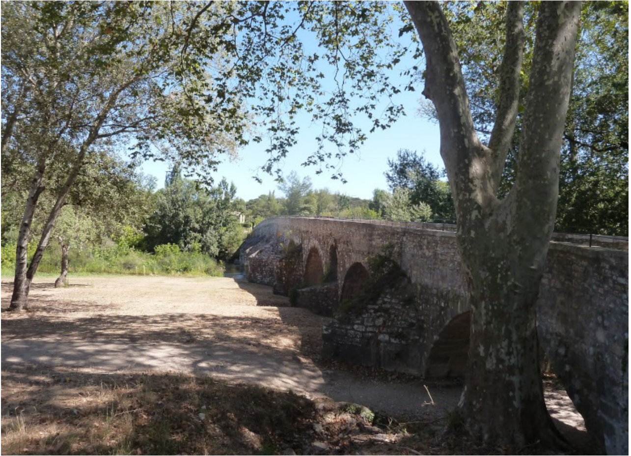
Die Brücke über die Seze bei Roque sur Seze