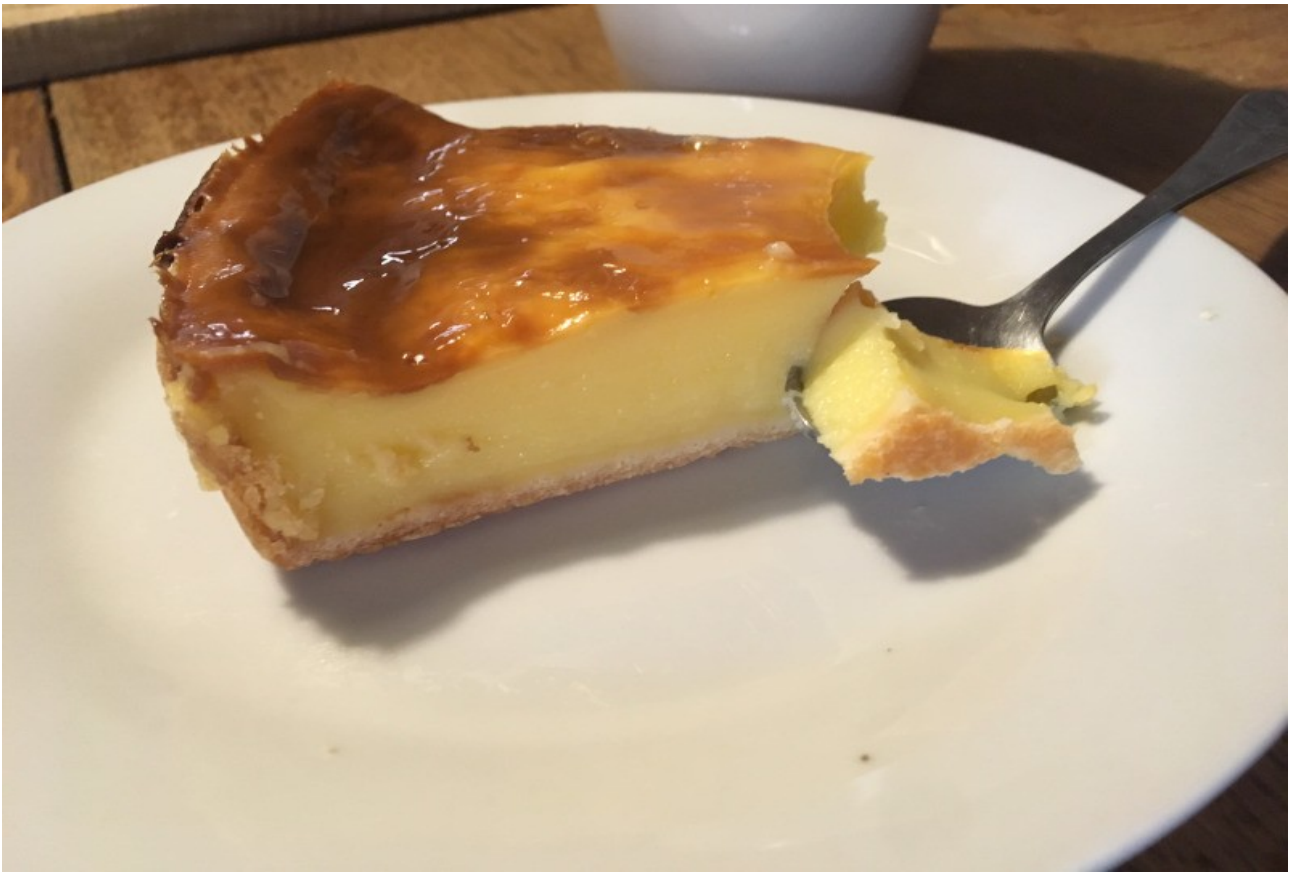
und unser Lieblingskuchen in Frankreich, ein Flan...