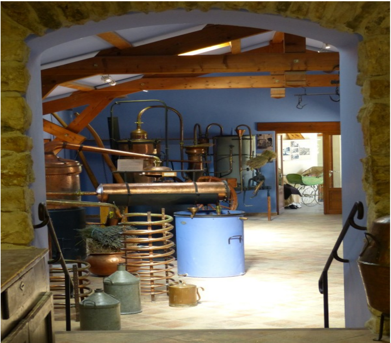
An der Ardeche abgebogen und schon an einem Lavendel Museum angekommen