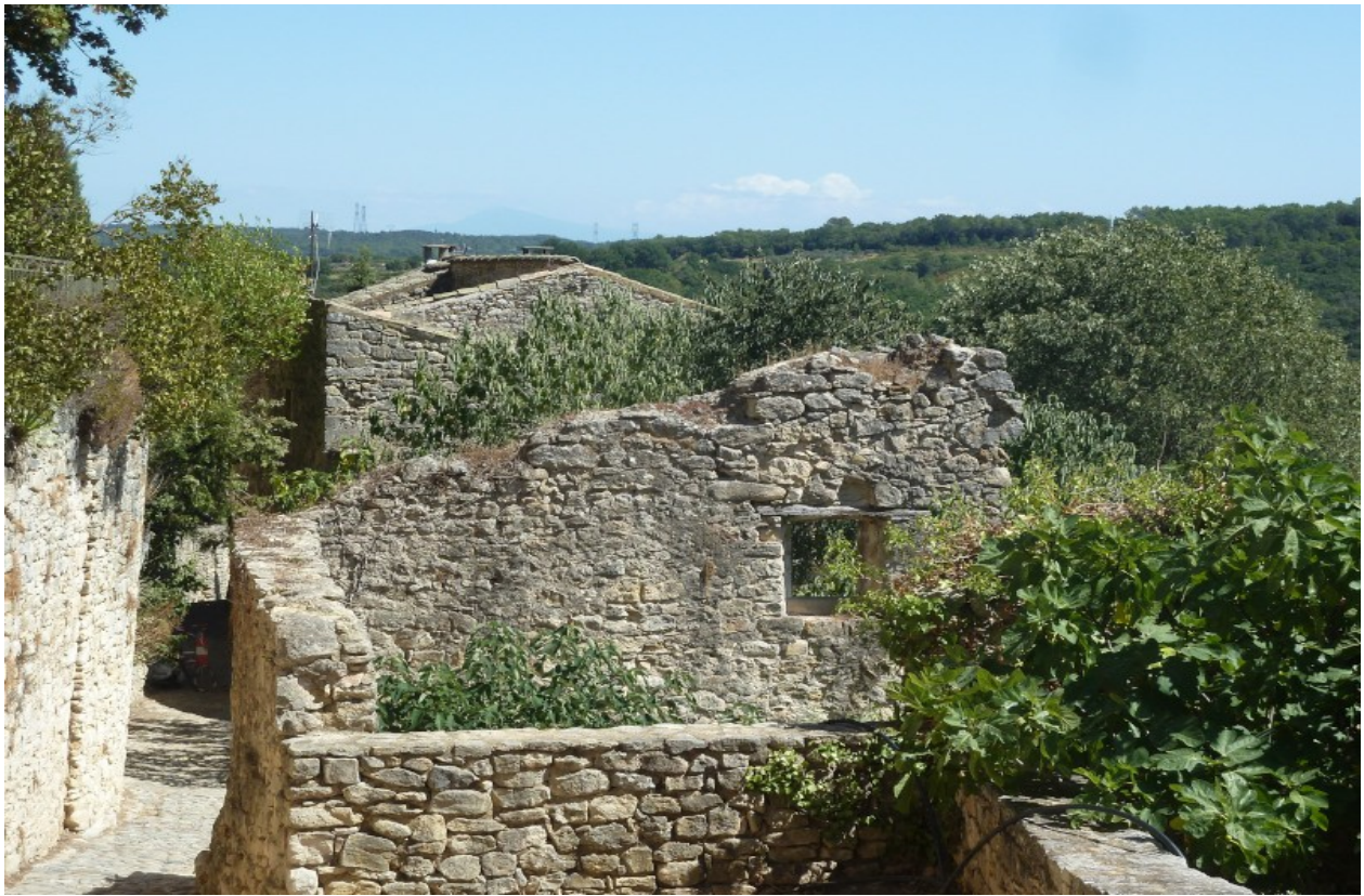
So sah Roque sur Seze in den 50ern aus...