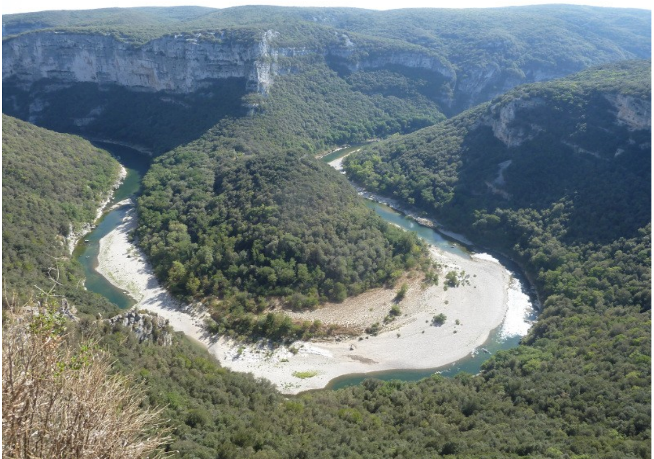
was für ein Ausblick an der Ardeche, ähnlich dem Grand Canyon de Verdon