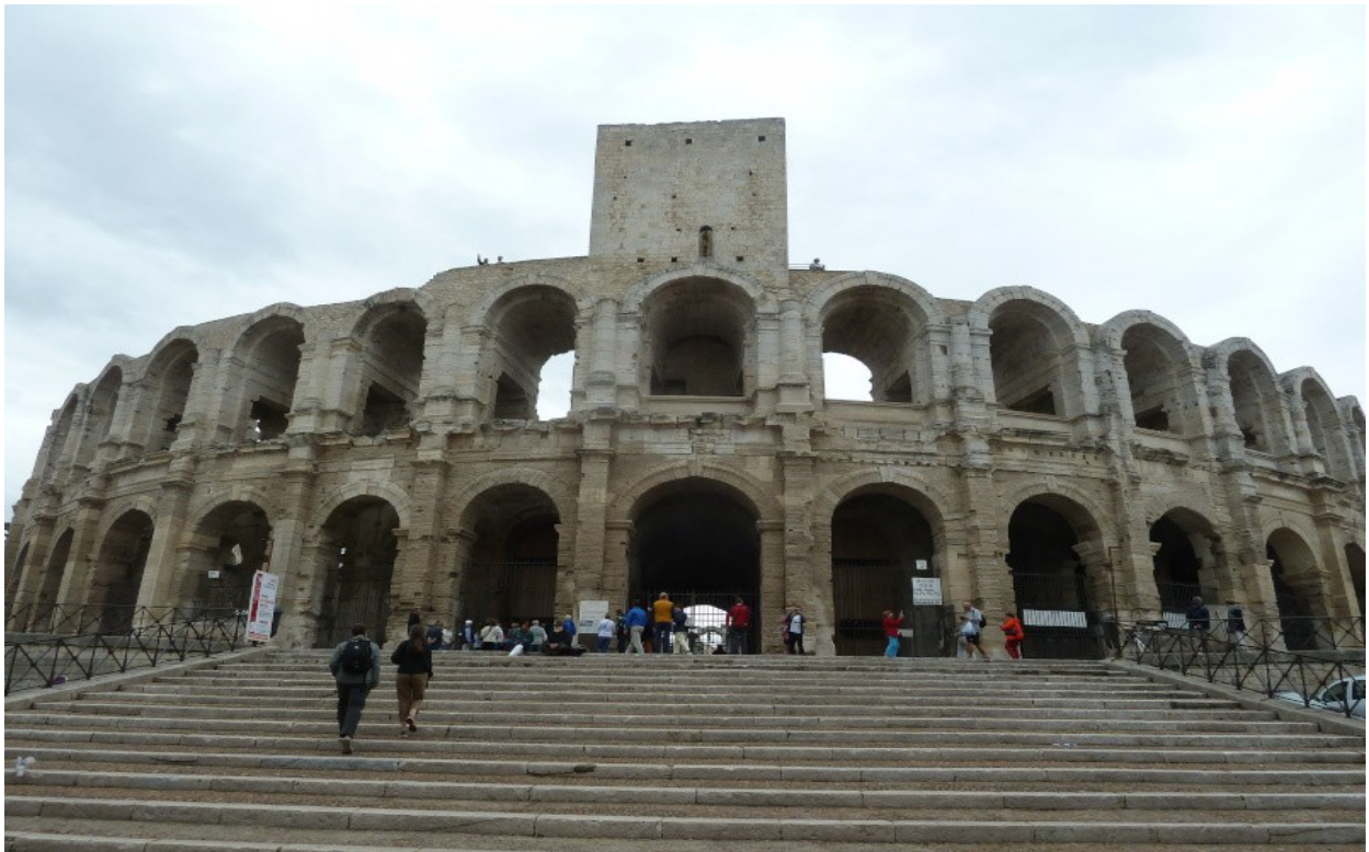
Die Arena von Arles