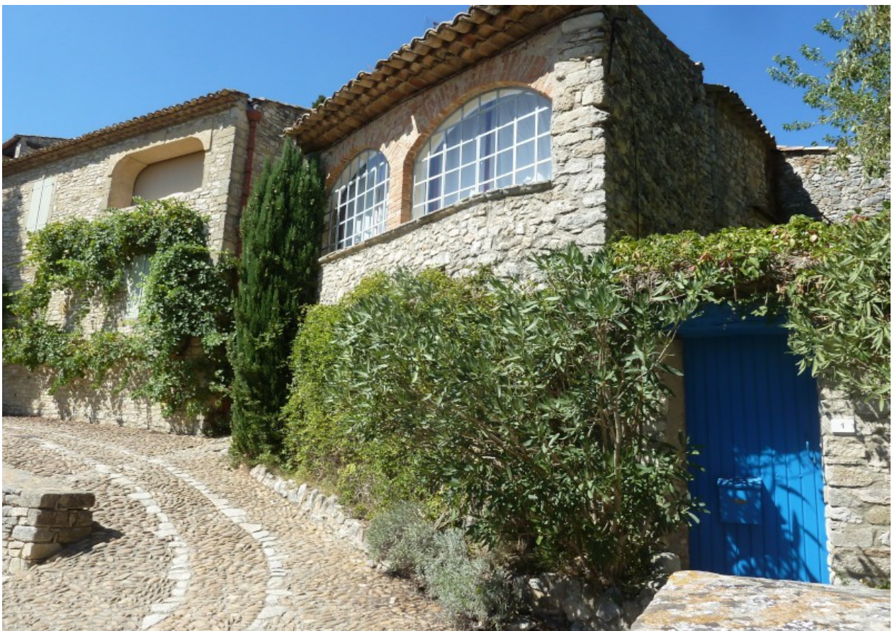
und so heute nachdem sich einige gefunden hatten diesen Ort wieder zu beleben