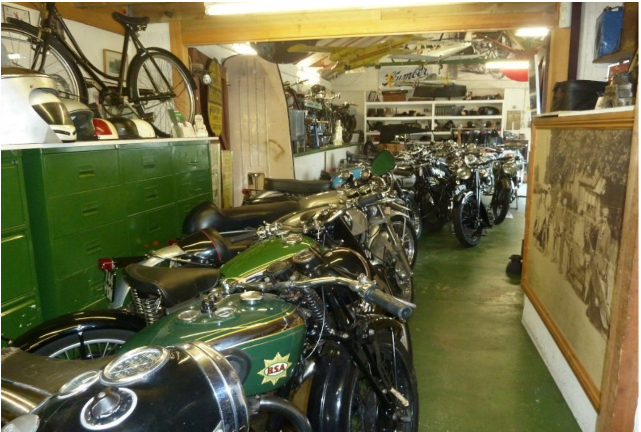
Schon faszinierend was sich so im Lauf der Zeit alles ansammelt