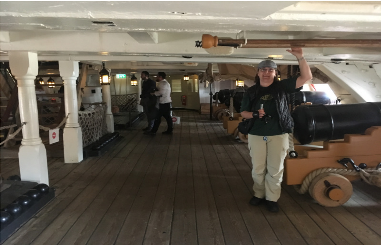
Kopf einziehen bitte