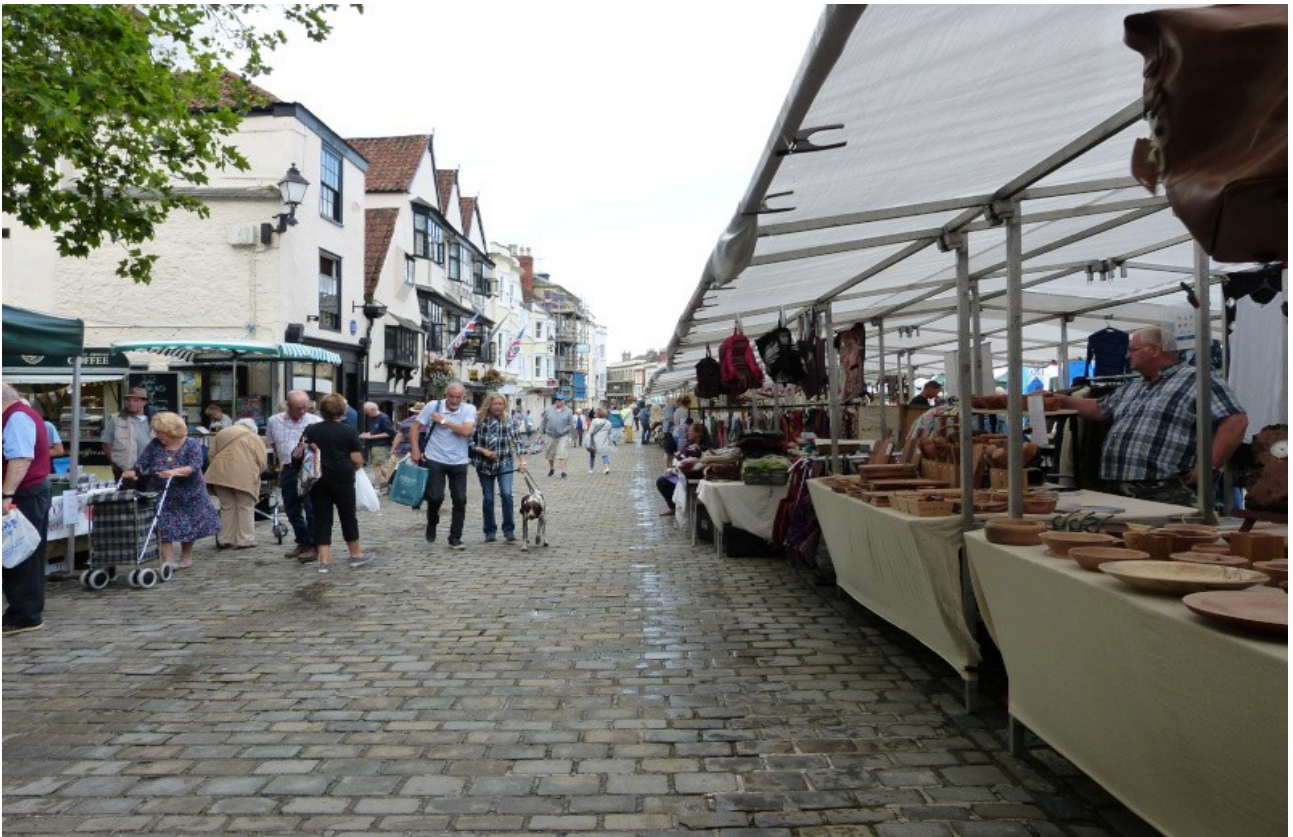
Wochenmarkt in Wells