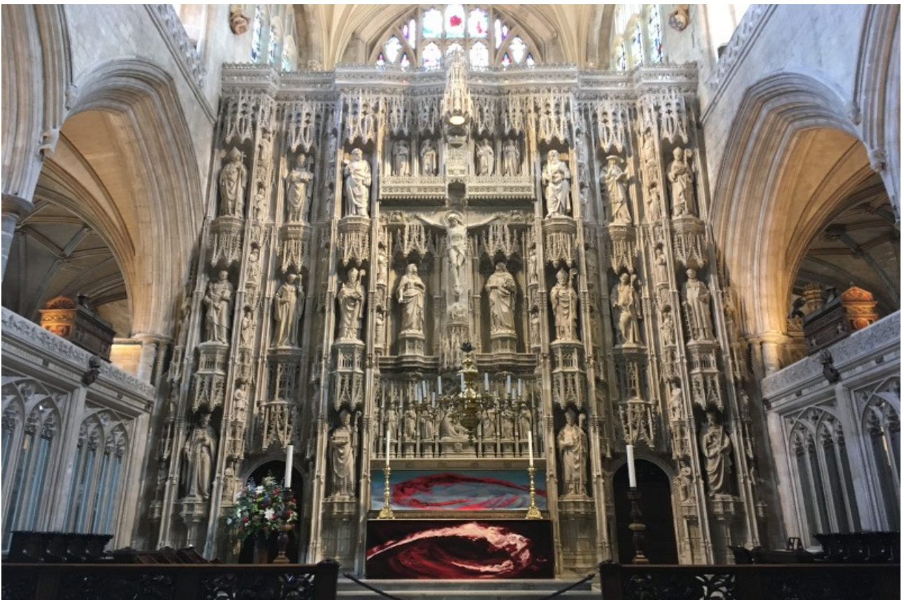
Das Innere der Kathedrale von Winchester