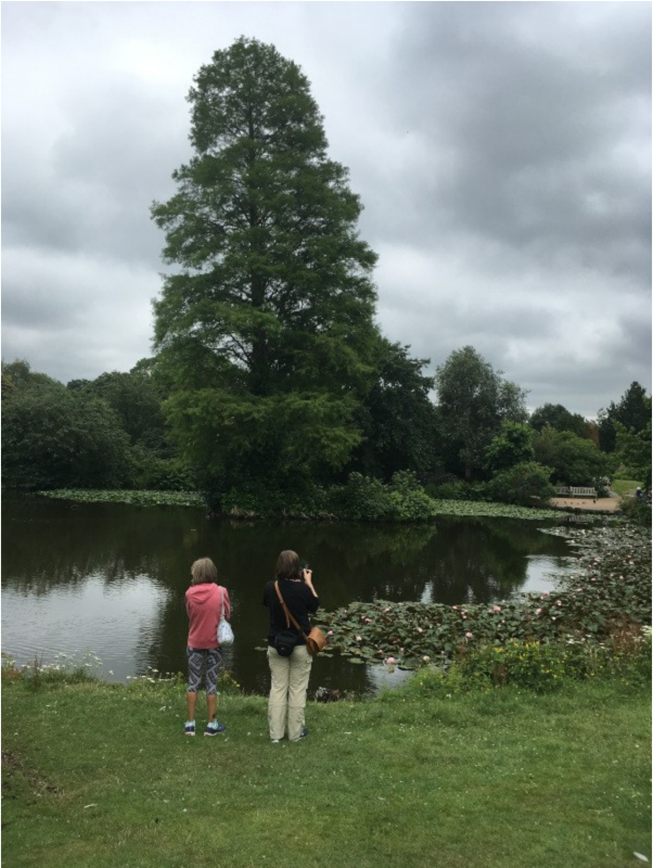
Unsere Mädels natürlich auch ;-)