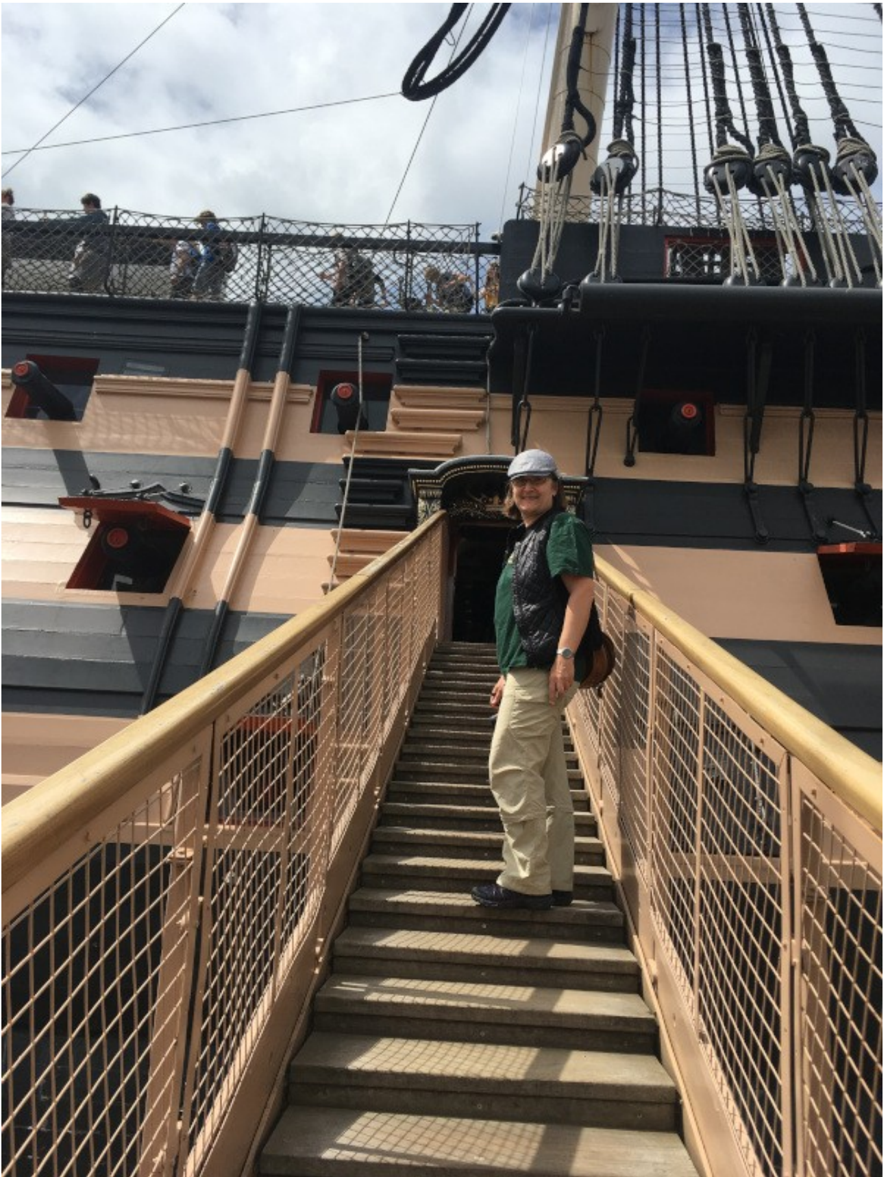
Wie die Zeit vergeht...