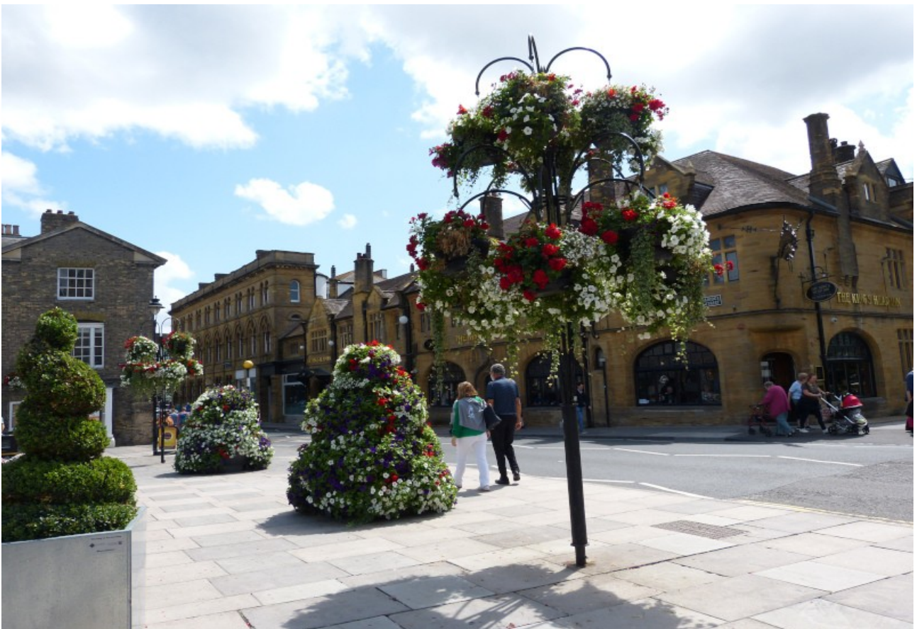
Salisbury, auf dem Weg zur Kathedrale