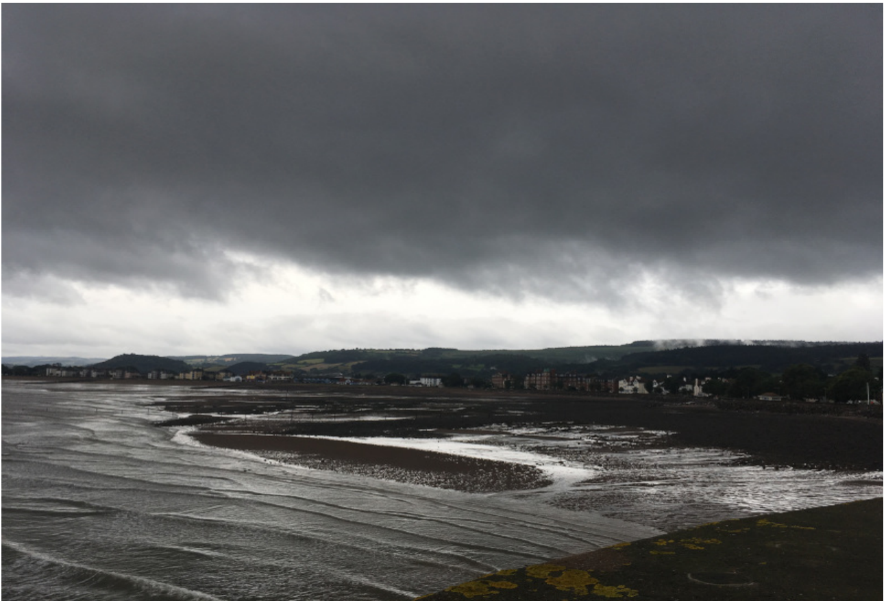
Hafen- und Bahnhofsimpressionen von Minehead