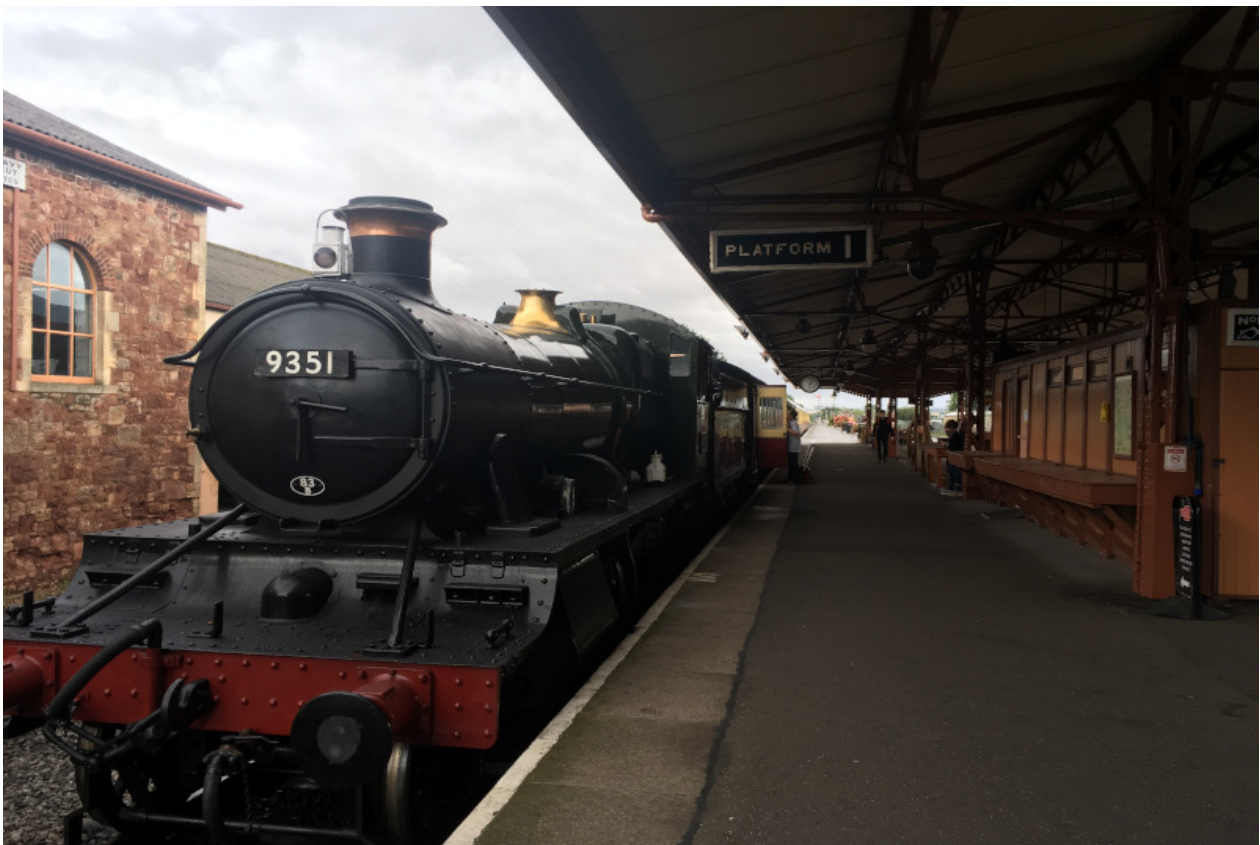
Hier wurden Szenen für „A Hard Days Night“, einen Beatles Film gedreht