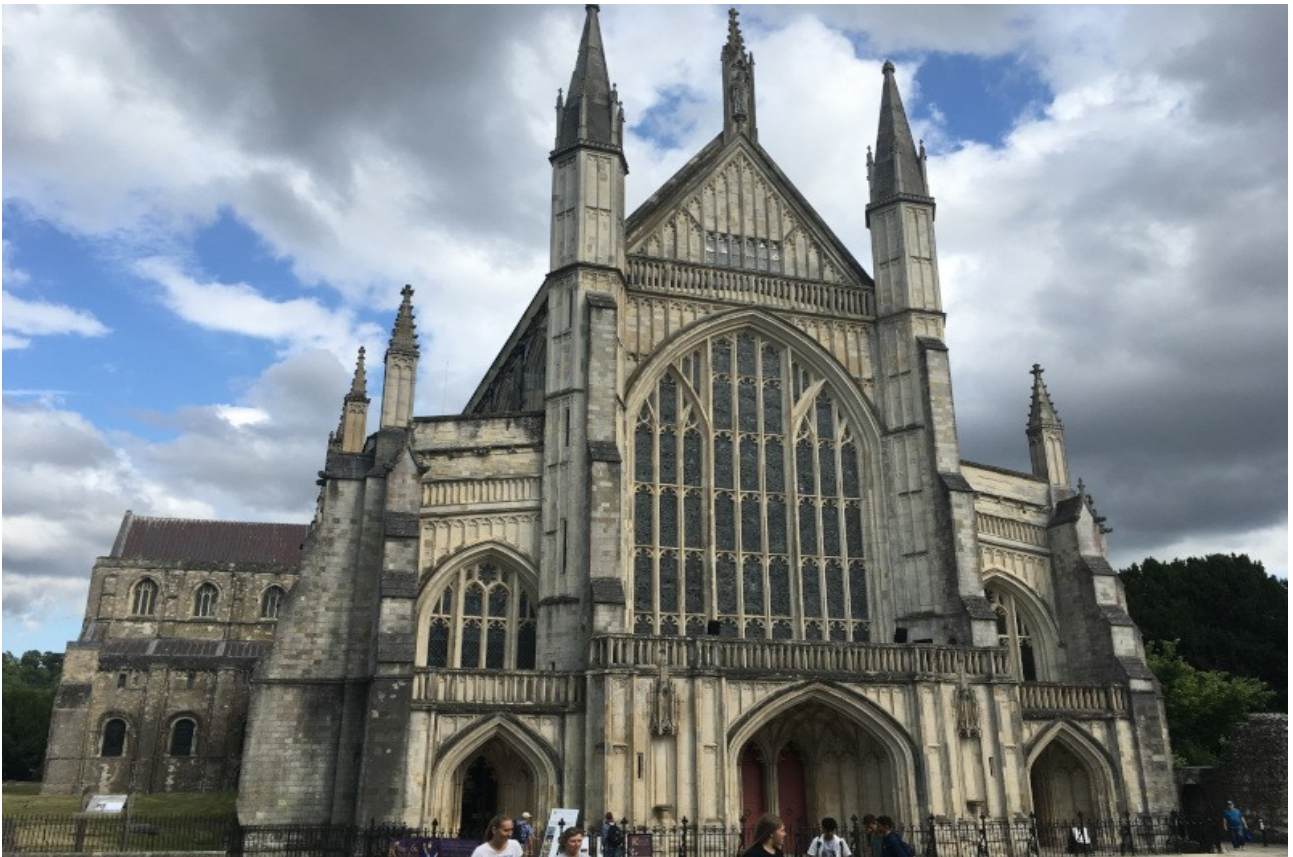
„Winchester Cathedral“ von der New Vaudeville Band war mal mein Lieblingslied