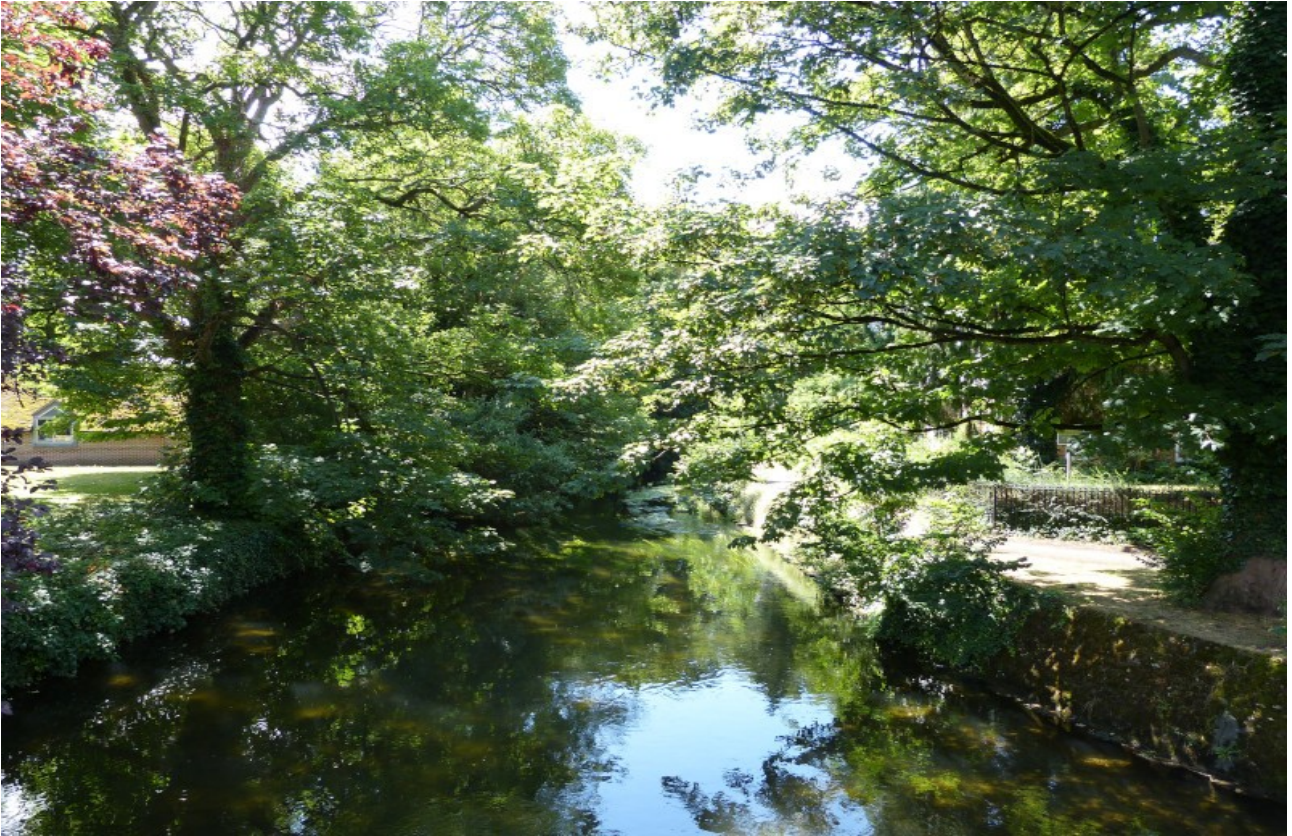
Salisbury, river Avon