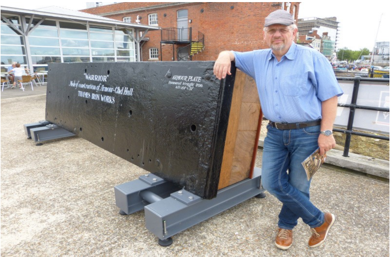
Ganz schön dick. Die Wand natürlich...:-)