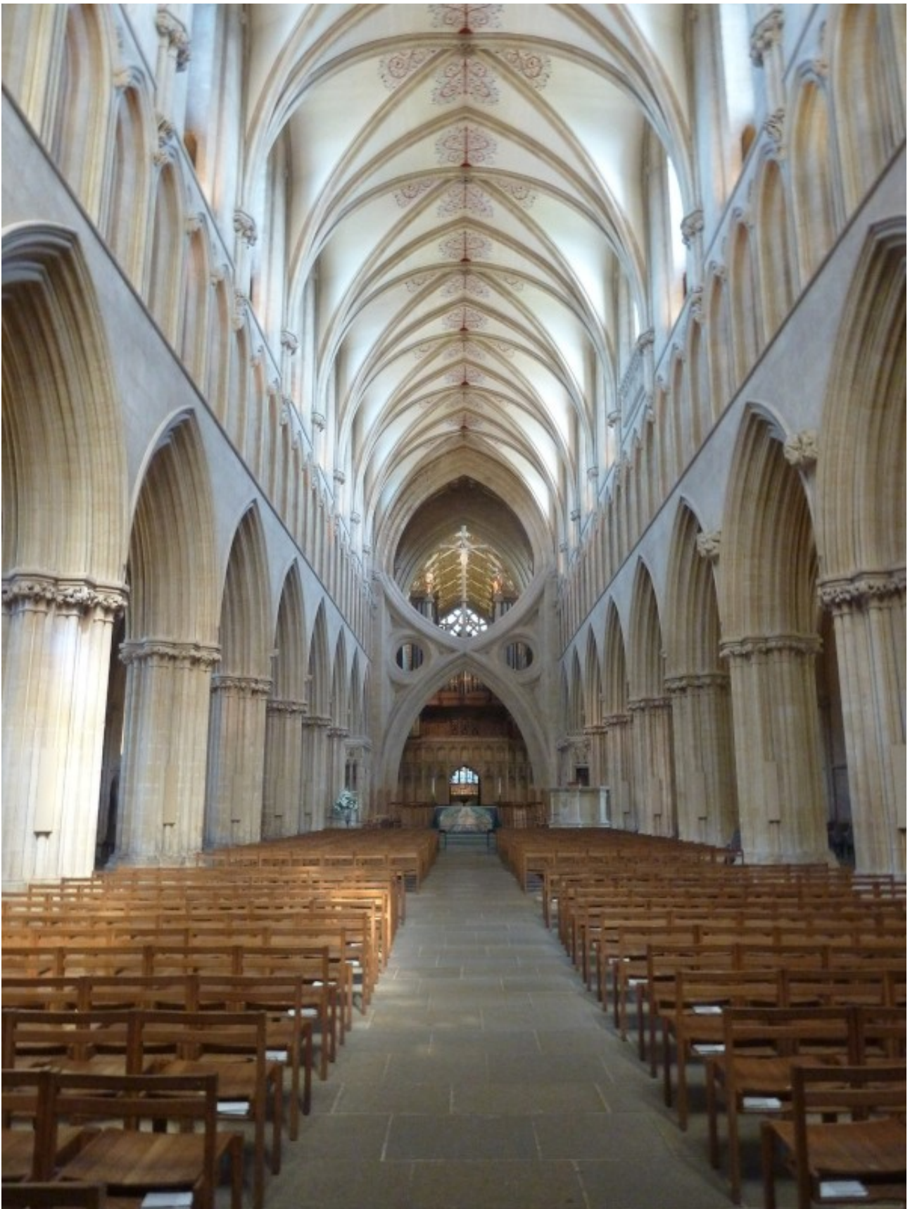
Gewaltig, ist das Einzige was mir dazu einfällt