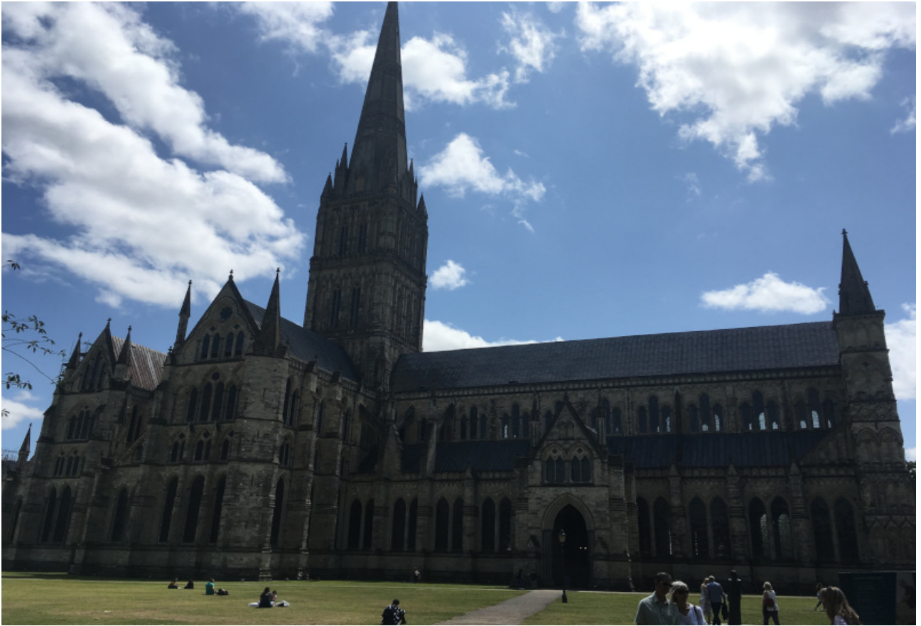
Die Kathedrale von Salisbury, sehenswert