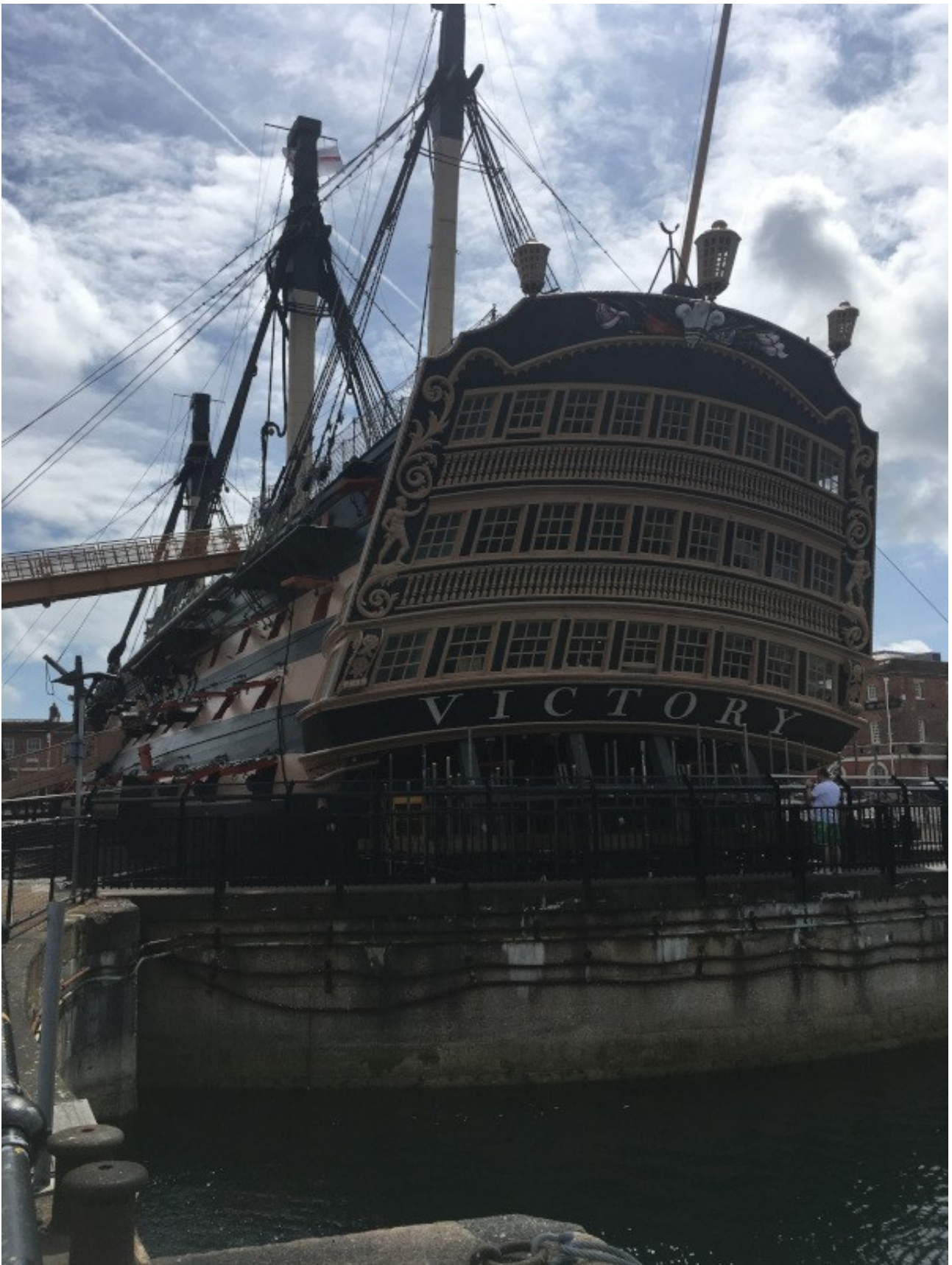
Hinter der obersten Glasfront befinden sich die Räumlichkeiten des Herrn Admiral, also Schlafkajüte mit Plumpsklo und ein Aufenthaltsraum mit Arbeitszimmer.