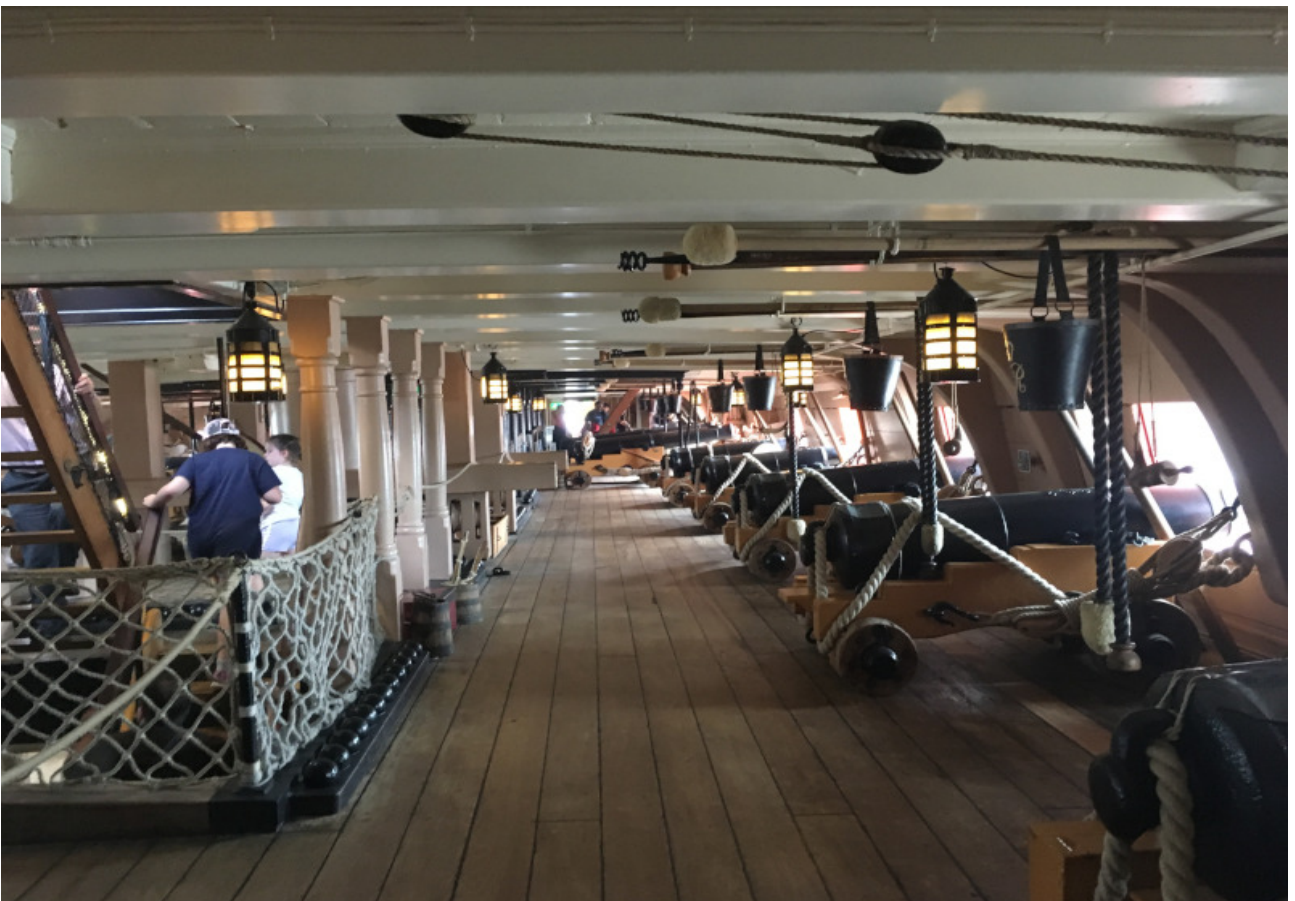
Achtung! Hier wurde scharf geschossen