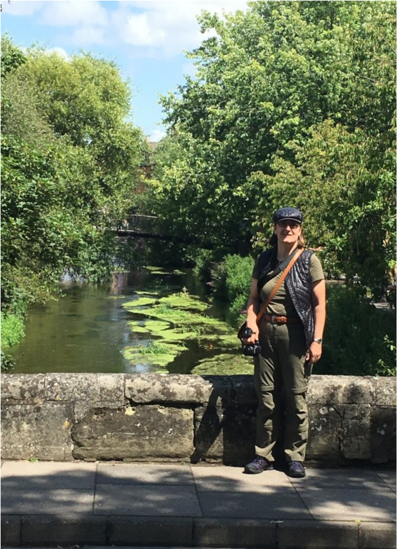
Salisbury, auf dem Weg zur Kathedrale und zur Magna Charta