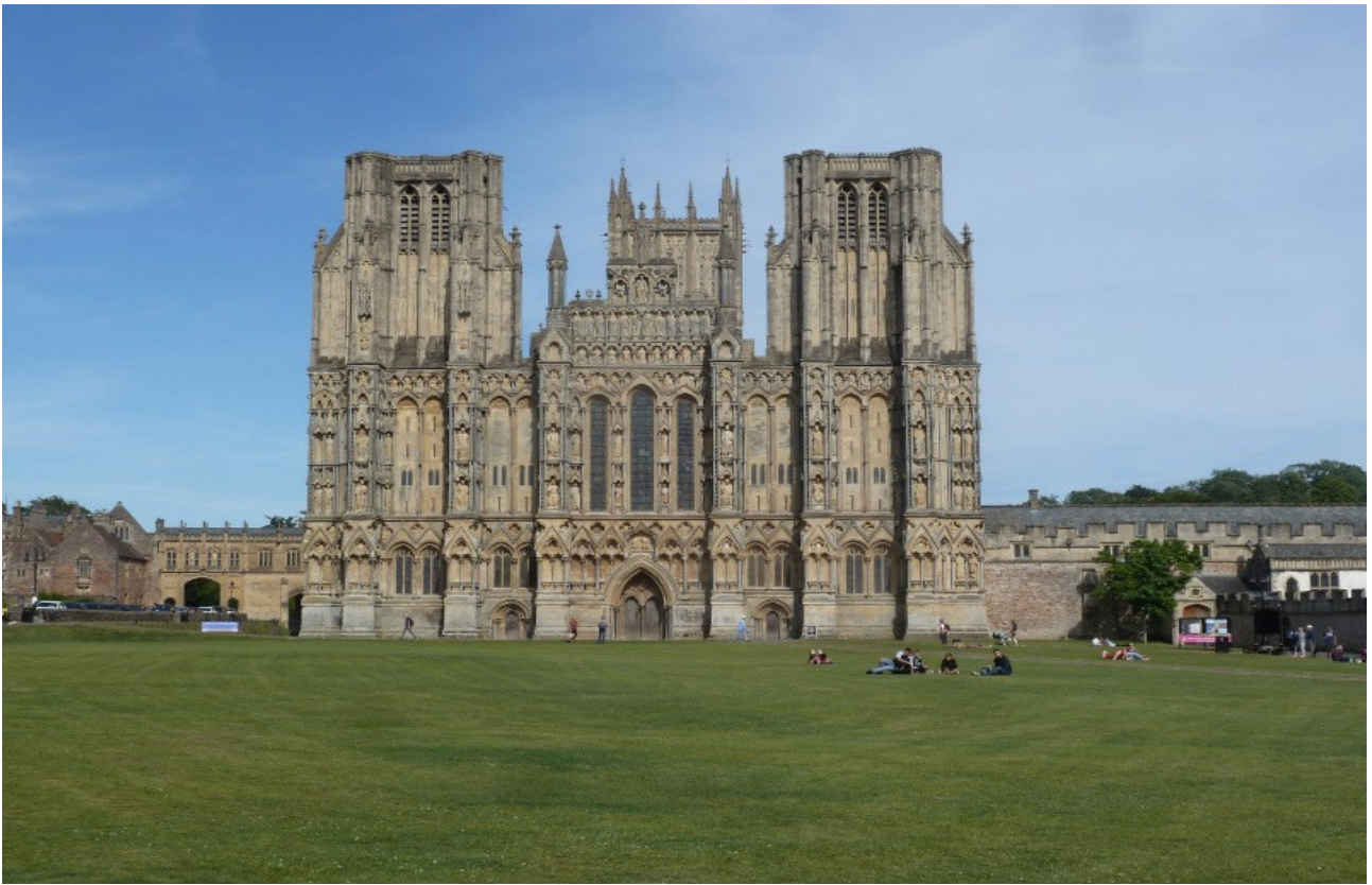
Die Kathedrale von Wells