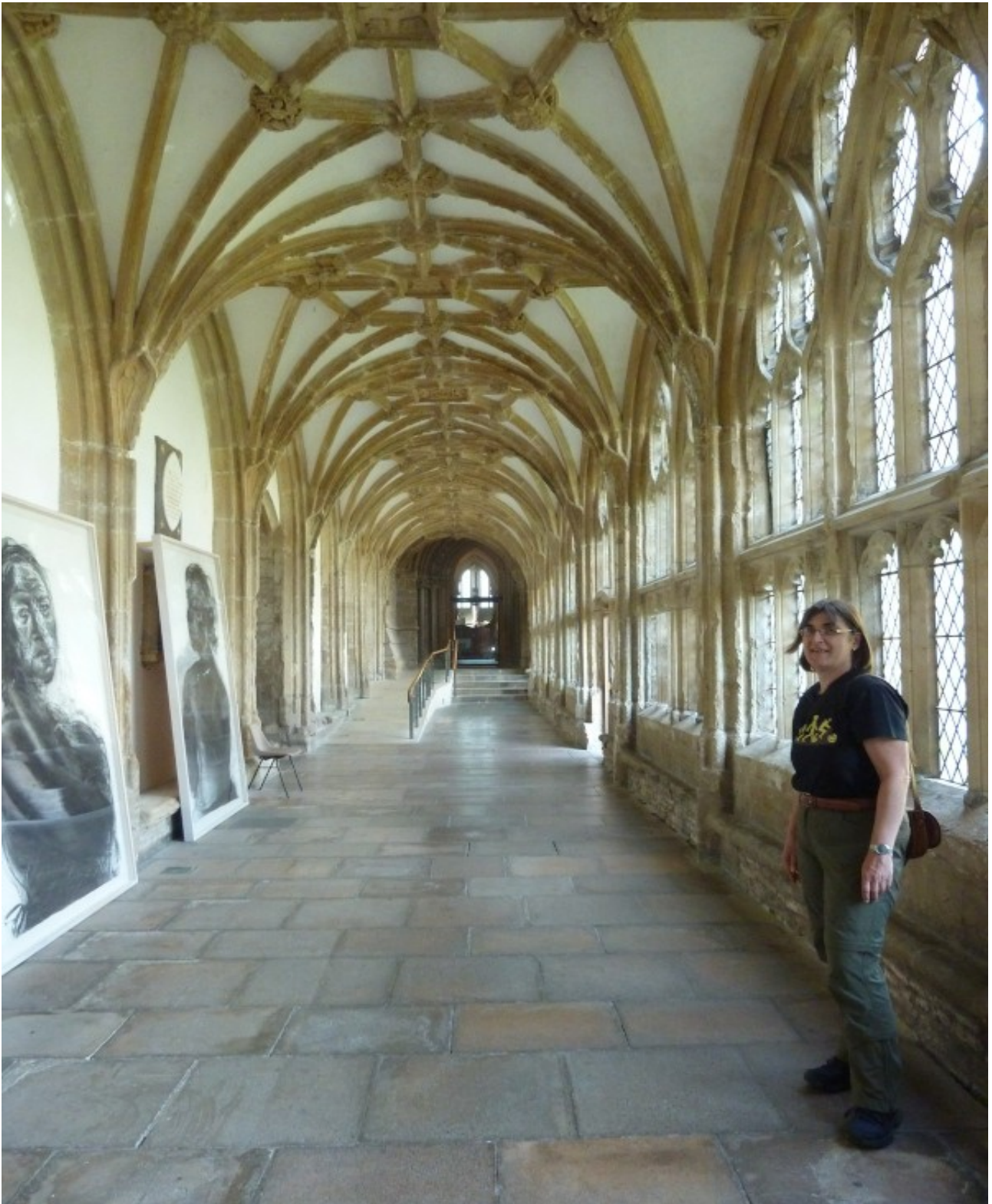
Im Inneren der Kathedrale von Wells