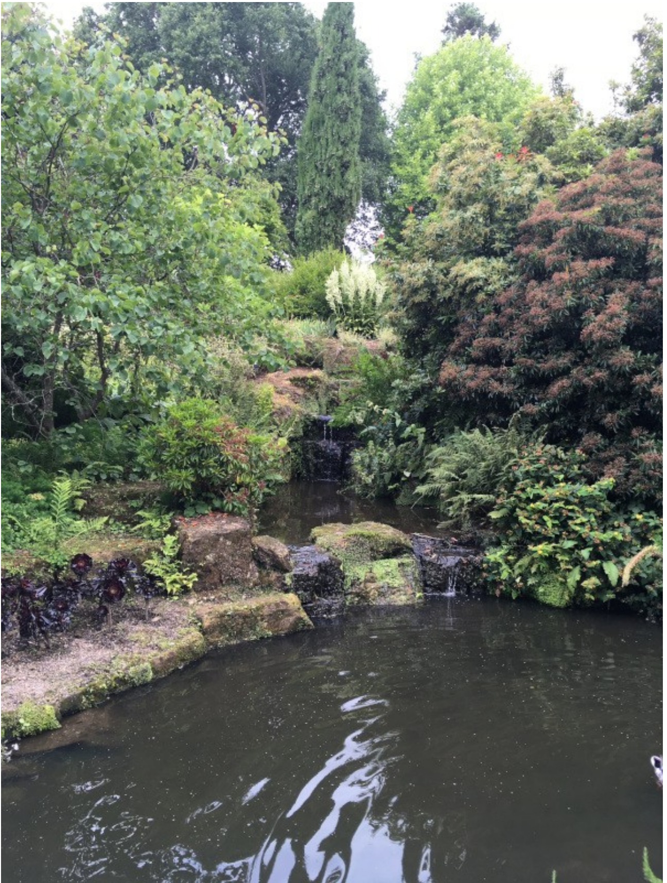
Ein mehrere Hektar großer Garten...