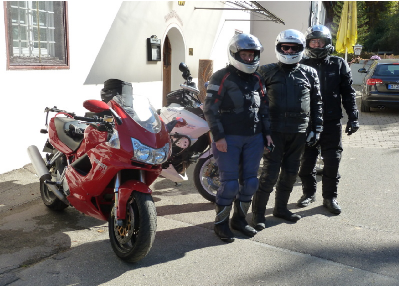
Mittagspause im Gasthaus Neumühle bei Beuron...