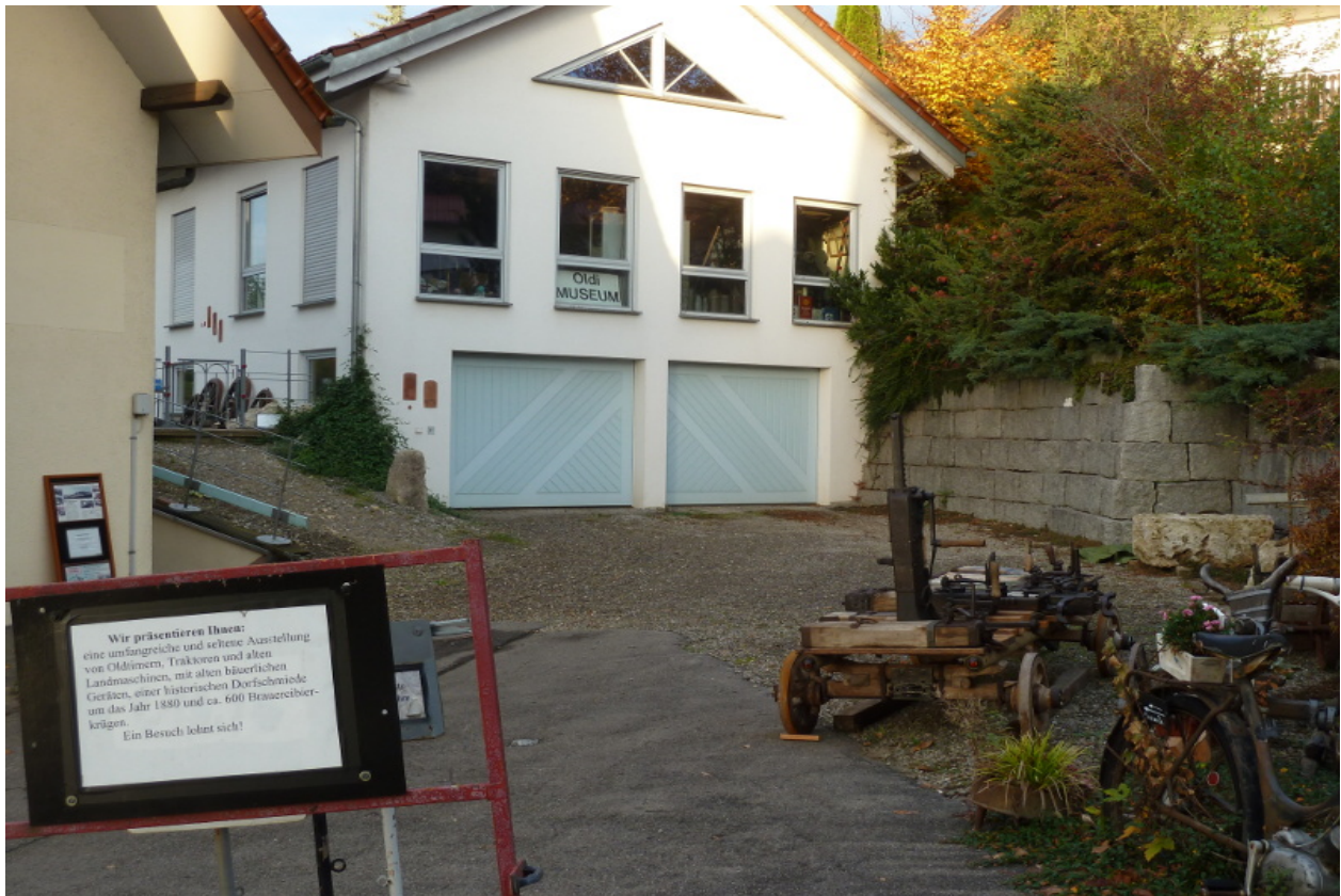
Das Oldtimer Museum des Gasthaus Schönblick....