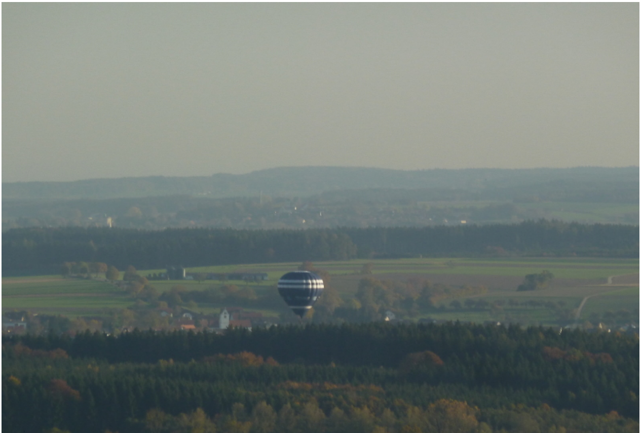
Spätnachmittag in Oberschwaben vom Bussen aus gesehen...