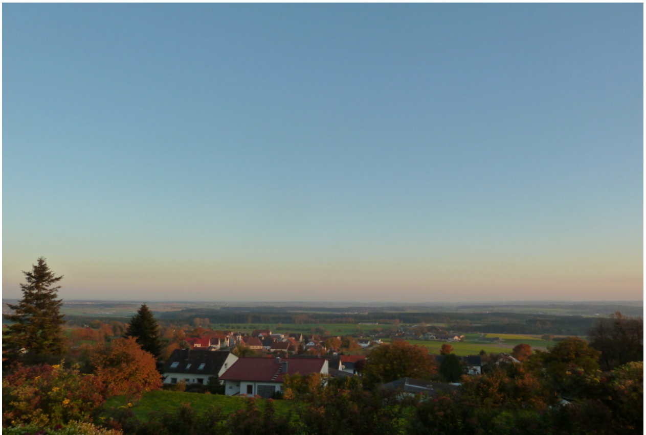
Der Bussen ist der Hausberg von Oberschwaben und man hat eine super Aussicht...