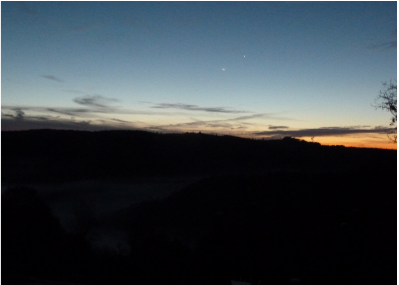
Sonnenuntergang über der schwäbischen Alb...