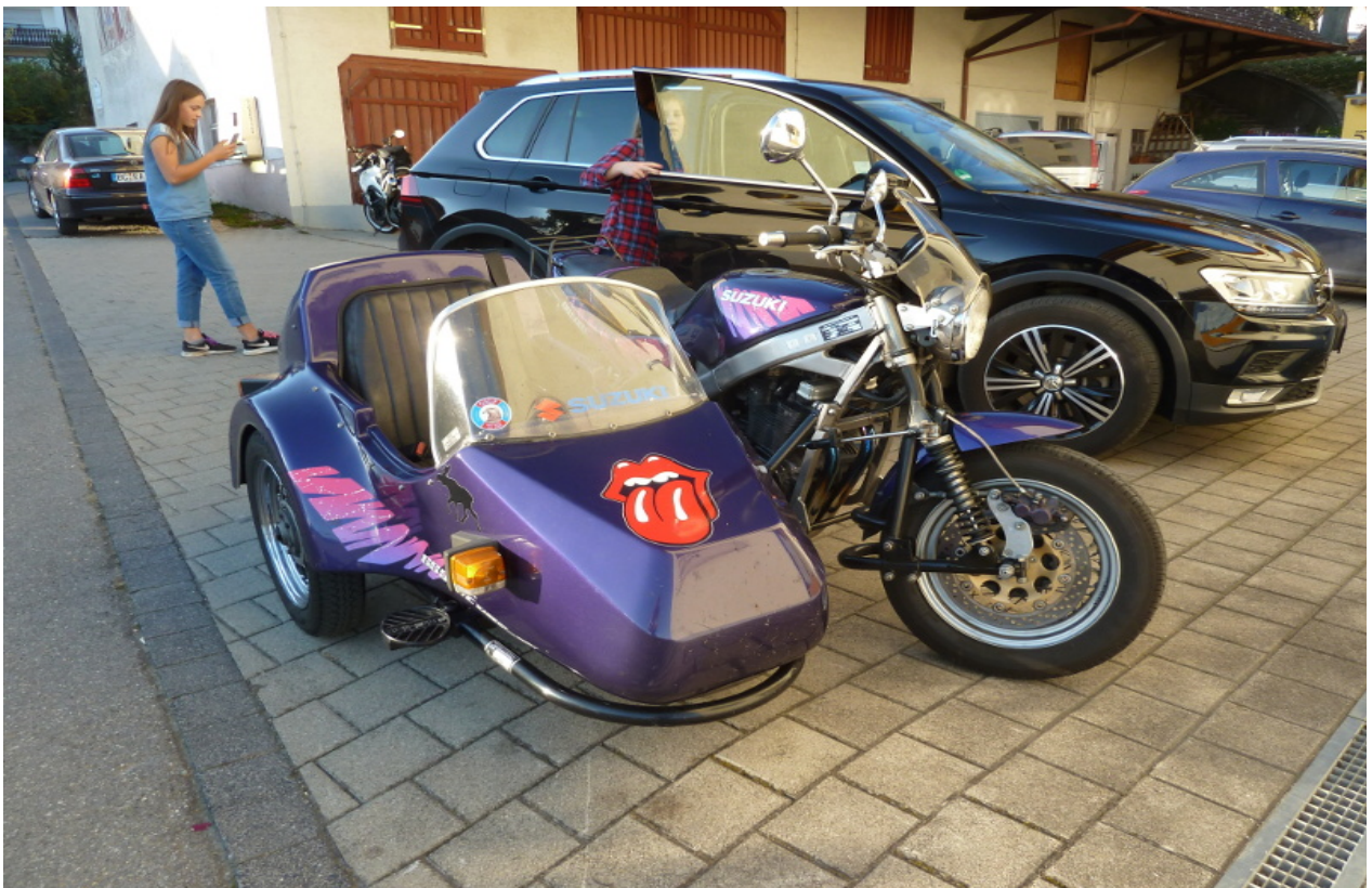
und dieses Gespann haben wir am Bussen entdeckt, wo wir auch übernachtet haben